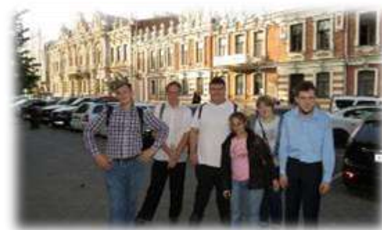
Сотрудничество с краснодарскими библиотеками