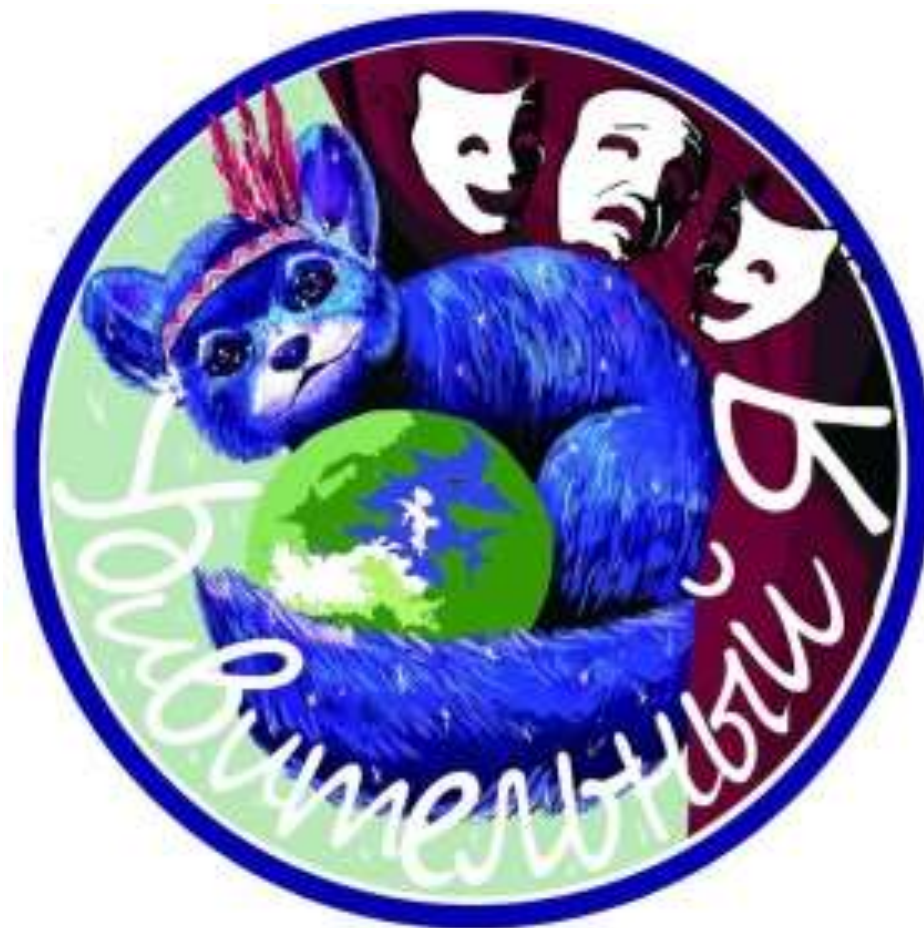
Логотип школьного театра «Удивительный Я»