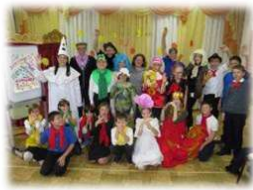
Школьный театр «Удивительный Я»