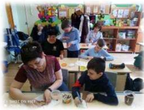
Творческая модель «Школа-ребенок-родитель»