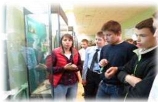
Взаимодействие с музеями и выставочными залами города