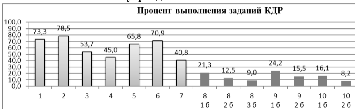
Средний процент выполнения заданий в общеобразовательных учреждениях

Светлым цветом на диаграмме выделены задания первой части.