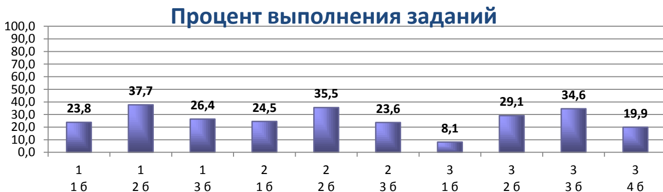
Диаграмма 3. Процент выполнения заданий