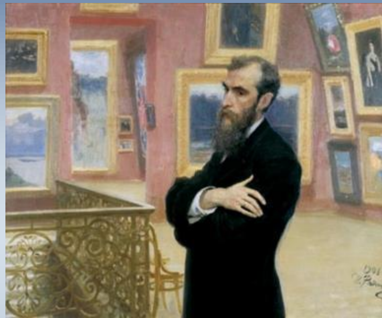
И. Репин. Портрет П. М. Третьякова