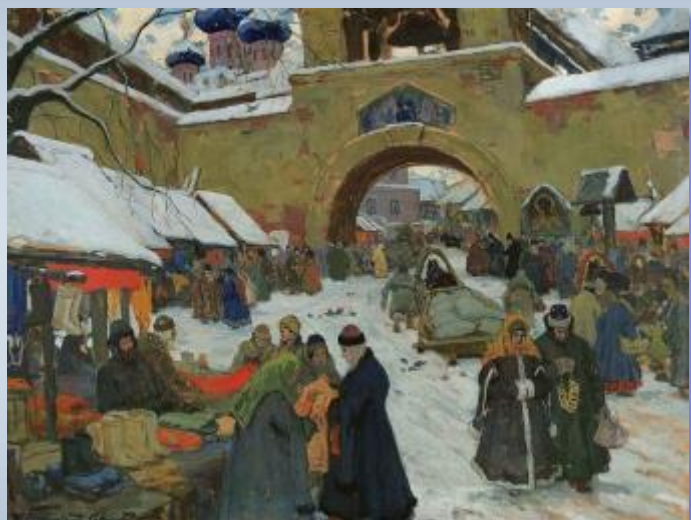
И. Горюшкин-Сорокопудов. Базарный день в старом городе