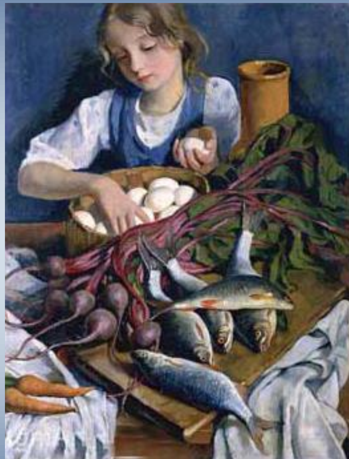
З. Серебрякова. Портрет Кати