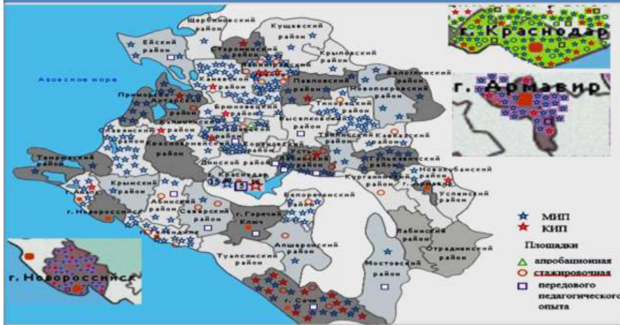
Карта инновационного образовательного развития Краснодарского края

В краевом инновационном Форуме «Инновационный поиск», в рамках которого проводится ряд инновационных конкурсов, по итогам которых 90 образовательным организациям присвоен статус «Краевая инновационная площадка».