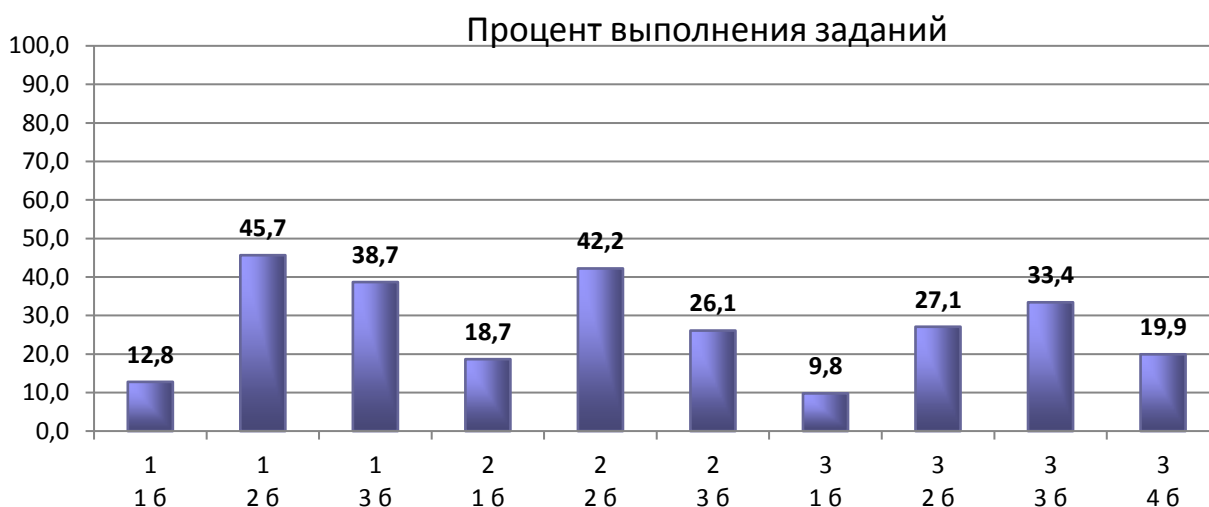
Диаграмма 3. Процент выполнения заданий

Анализ диаграммы 3 показывает, что в КДР-9 по литературе наибольшие затруднения вызвало задание 3 (развернутое сопоставление анализируемого произведения с художественным текстом, приведенным для сопоставления): 80,4% учащихся продемонстрировали удовлетворительный уровень умения сопоставлять данные тексты в заданном направлении анализа, однако 19,6% писавших получили 0 баллов.