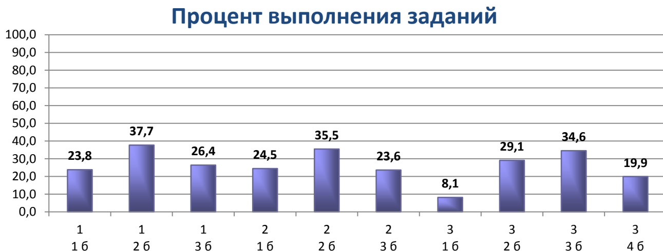
Диаграмма 3. Процент выполнения заданий

Анализ диаграммы 3 показывает, что в КДР-9 по литературе наибольшие затруднения вызвало задание 2 (развернутые рассуждения о тематике и проблематике фрагмента произведения, о видах и функциях изобразительно-выразительных средств и элементах художественной формы, при этом направление анализа текста было ориентировано на выявление уровня владения школьниками литературоведческой терминологией): с заданием не справились 16,4% писавших КДР.