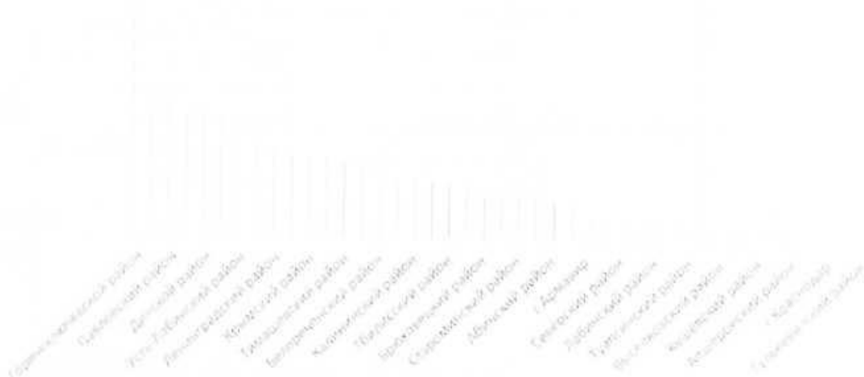
Рисунок 3 – Рейтинг ТМС по количеству посещенных сетевых мероприятий

На рис. 3 представлен рейтинг ТМС по количеству участия в сетевых мероприятиях в I полугодии 2021 года.