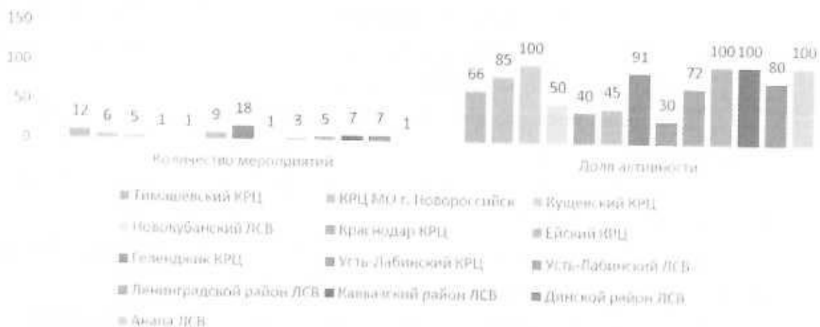
Рисунок 1 – активность участников сети в мероприятиях проекта «Движение вверх»

На рисунке 1 видно, что за отчетный период организаторы мероприятий провели от 1 до 27 мероприятий за I полугодие, посещаемость которых составила от 30% до 100%.