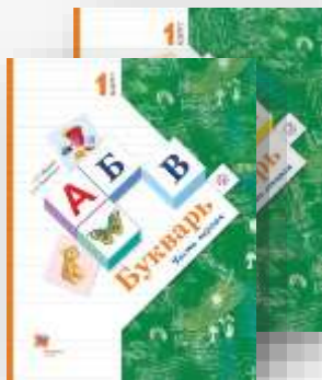
Журова Л.Е., Евдокимова А.О. Букварь