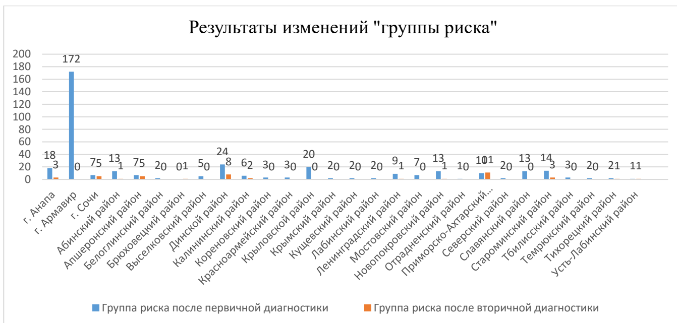
Диаграмма 2. Изменения результатов диагностики обучающихся «группы риска»

По результатам двух этапов диагностики в «группу риска» попали 43 обучающихся (0,45 % от исследуемых детей). Результаты изменений представлены в диаграмме 2.