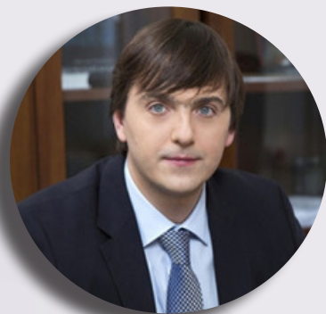
Министр просвещения Сергей Кравцов

«Министерство просвещения делает все, чтобы возрождалась сельская школа, село, чтобы они становились центрами притяжения. Очень важно сохранить и развивать сельскую школу».