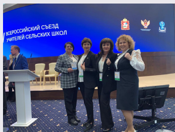
Участники V Всероссийского съезда учителей сельских школ, представляющих Краснодарский край

В Красногорск Московской области открылся V Всероссийский форум учителей сельских школ. На форуме собрались более 200 учителей из 56 регионов Российской Федерации.