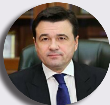
Губернатор Московской области Андрей Воробьев

(из приветственного слова на V Всероссийском съезде учителей сельских школ)