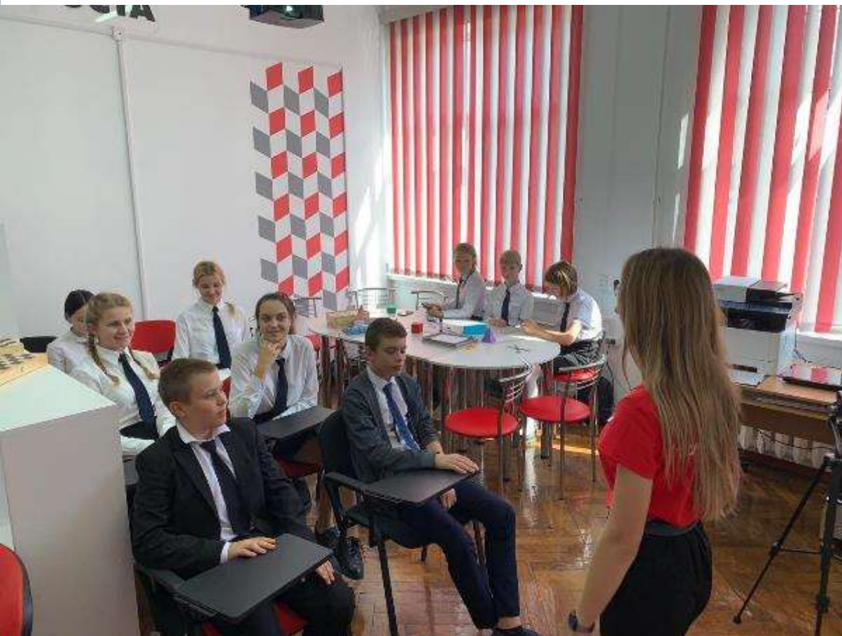
СОШ № 35 Динской район