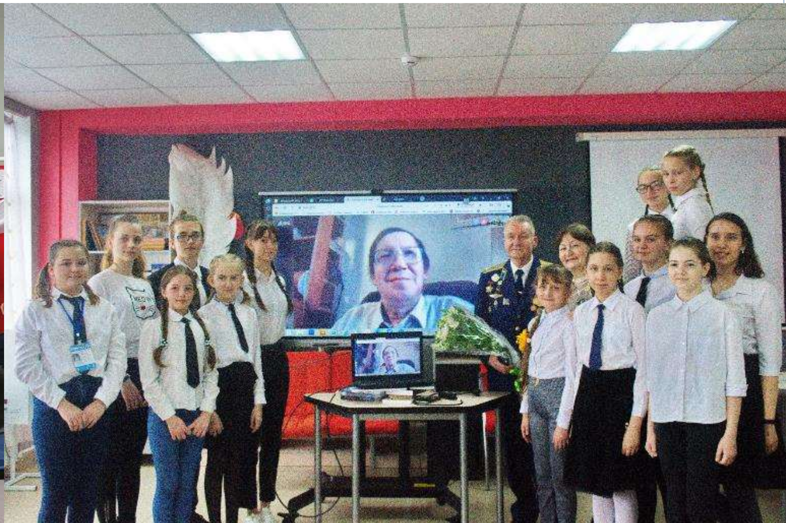
СОШ № 18 Выселковский район