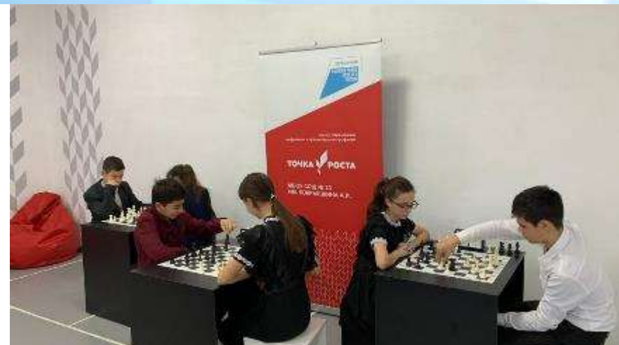
СОШ № 23 Куцевский район