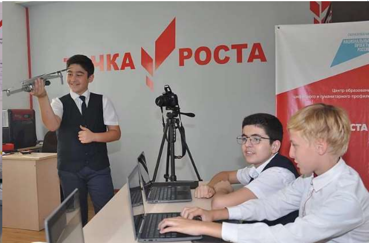
СОШ № 29 Белореченский район