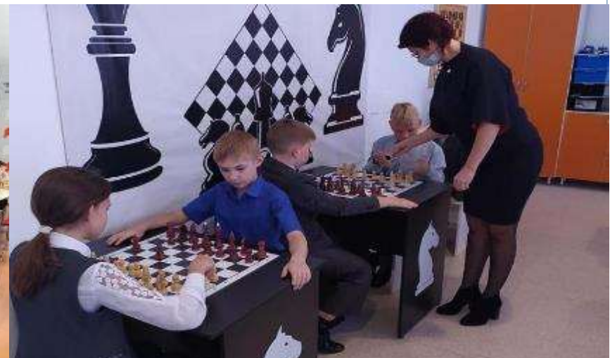
СОШ № 41 Кореновский район