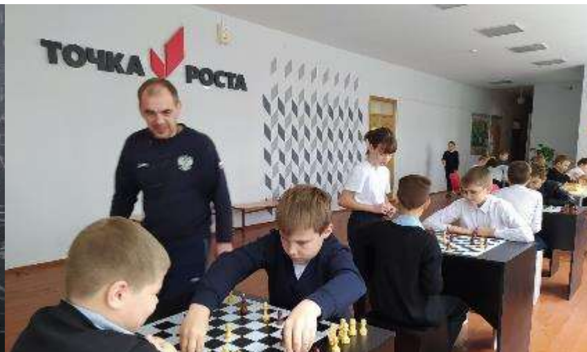
СОШ № 4 Каневской район