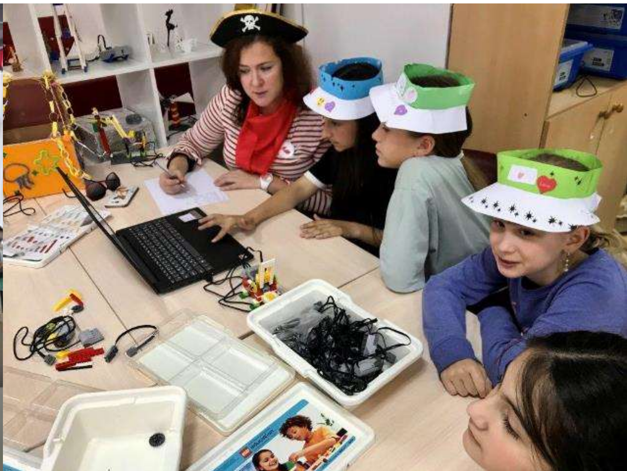
СОШ № 66 г. Сочи