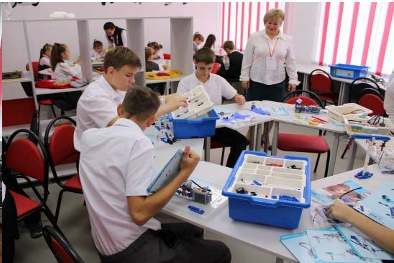
СОШ № 13 Гулькевичский район