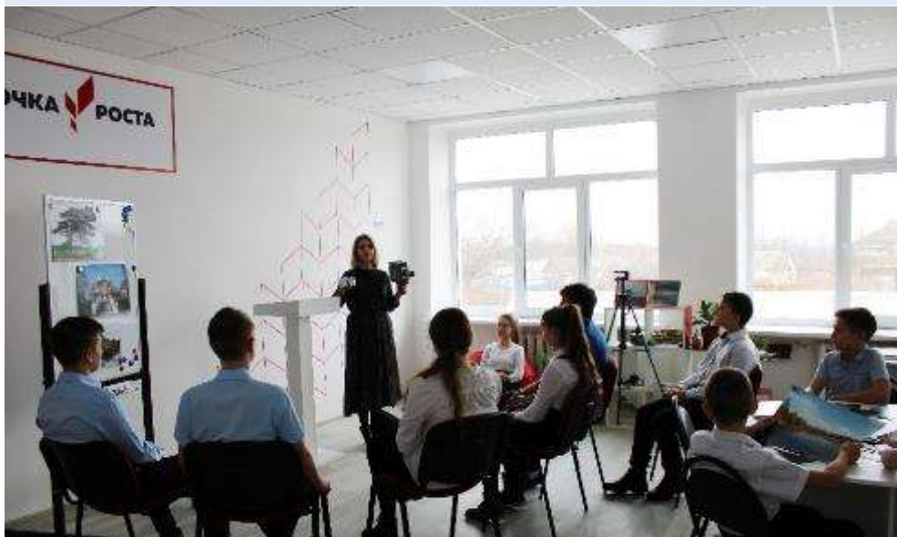
СОШ № 6 Новокубанский район