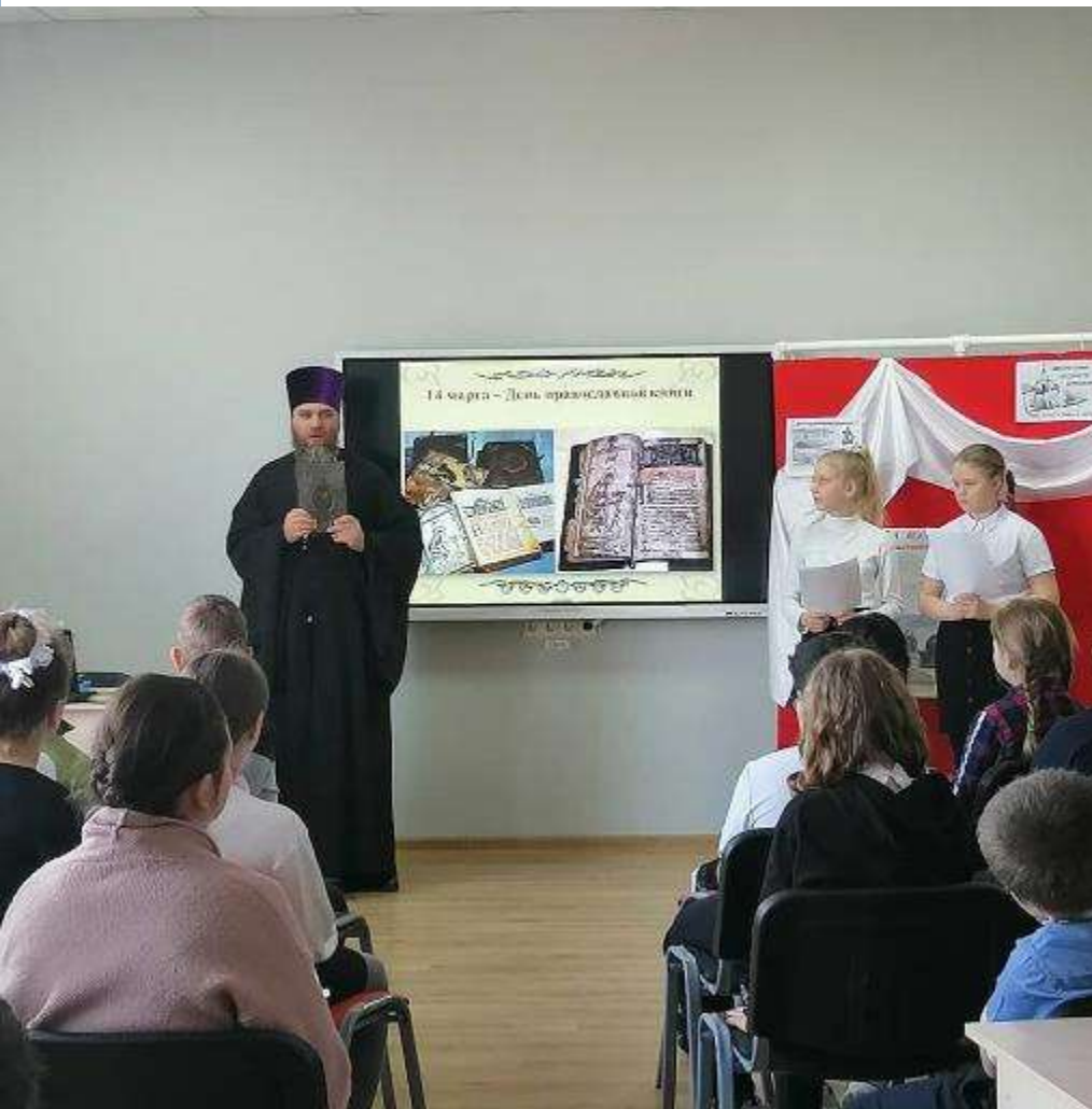
СОШ № 32 Каневской район