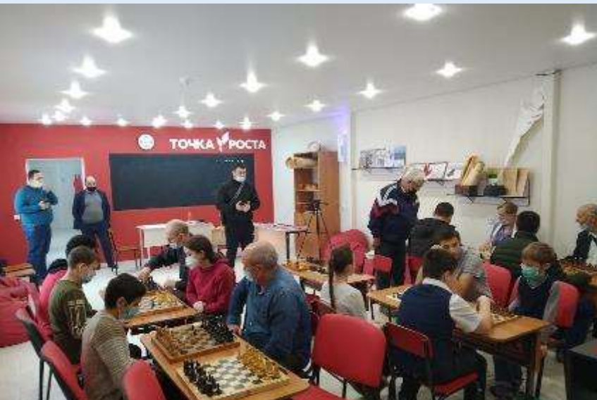
СОШ № 3 г. Анапа