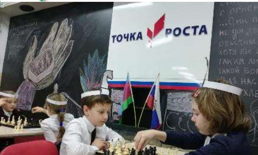
СОШ № 6 г. Горячий Ключ