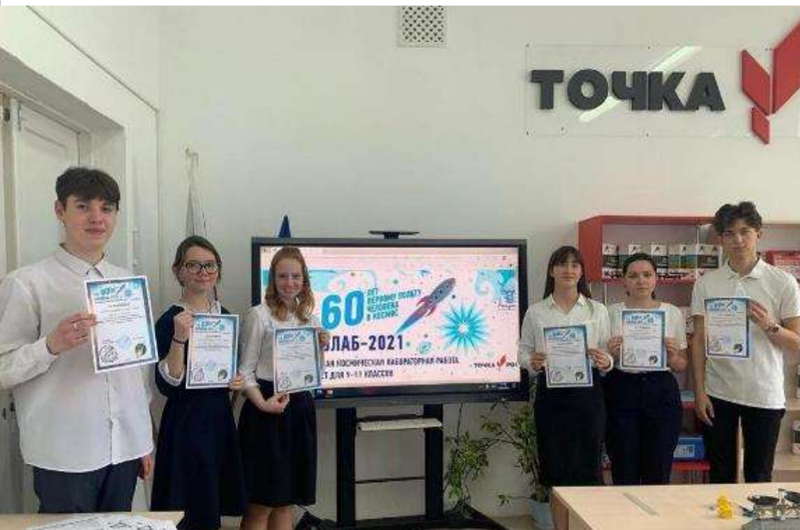
СОШ № 59 Северский район