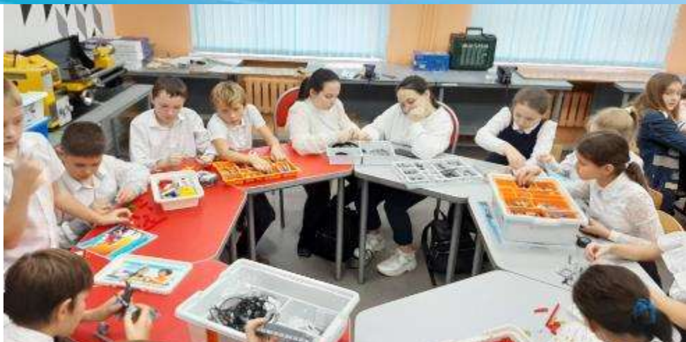
СОШ № 7 г. Геленджик