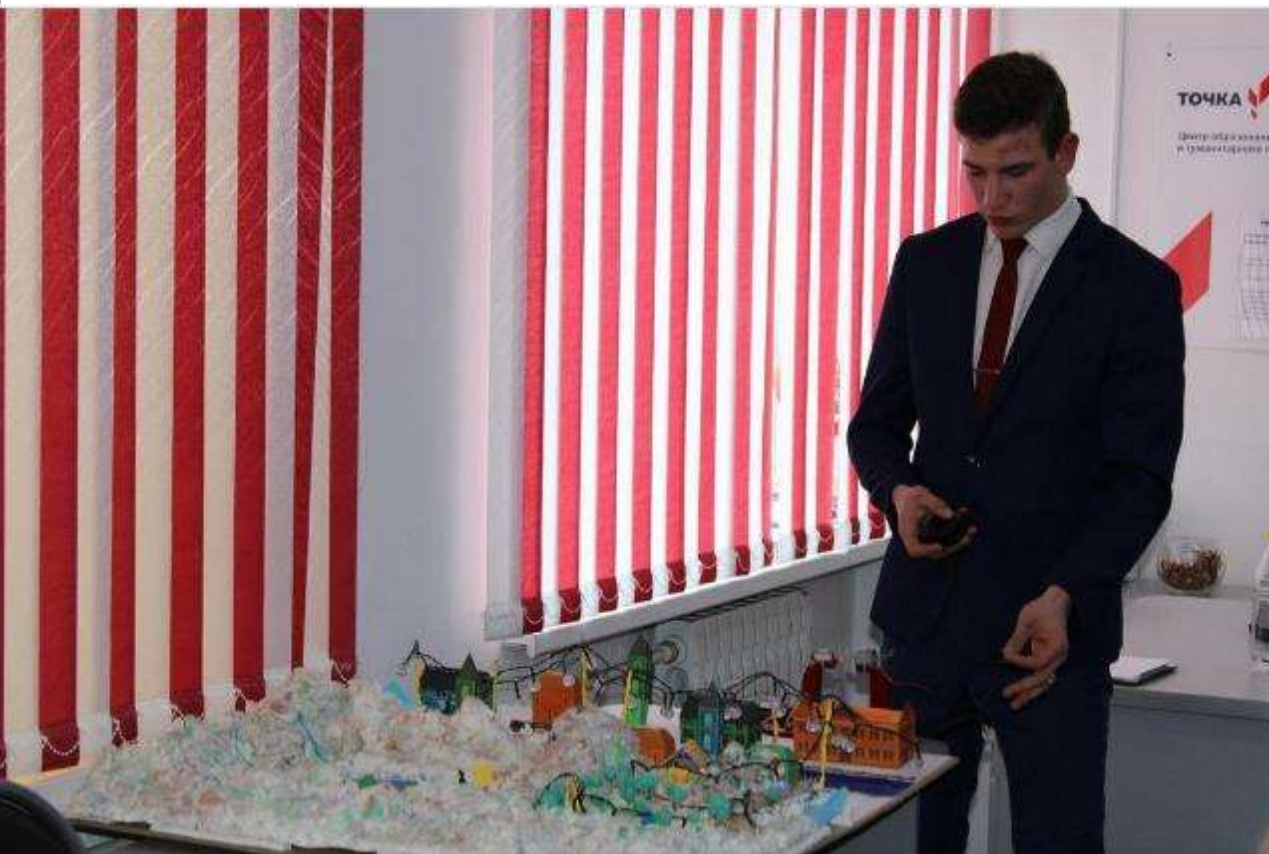
СОШ № 7 Мостовский район