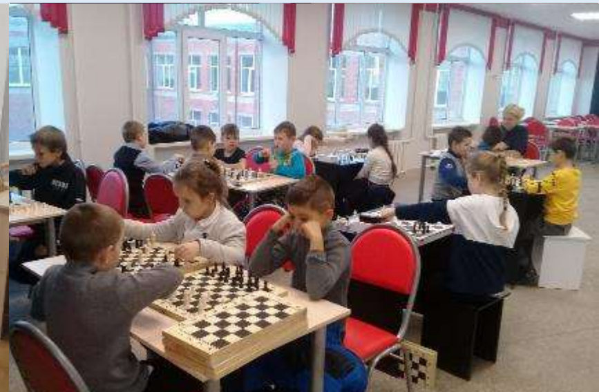
СОШ № 9 Темрюкский район