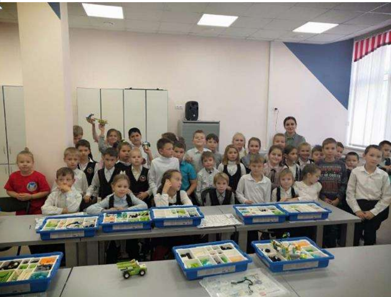
СОШ № 61 г. Краснодар