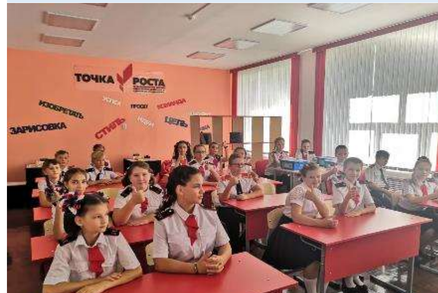
СОШ № 3 Ленинградский район