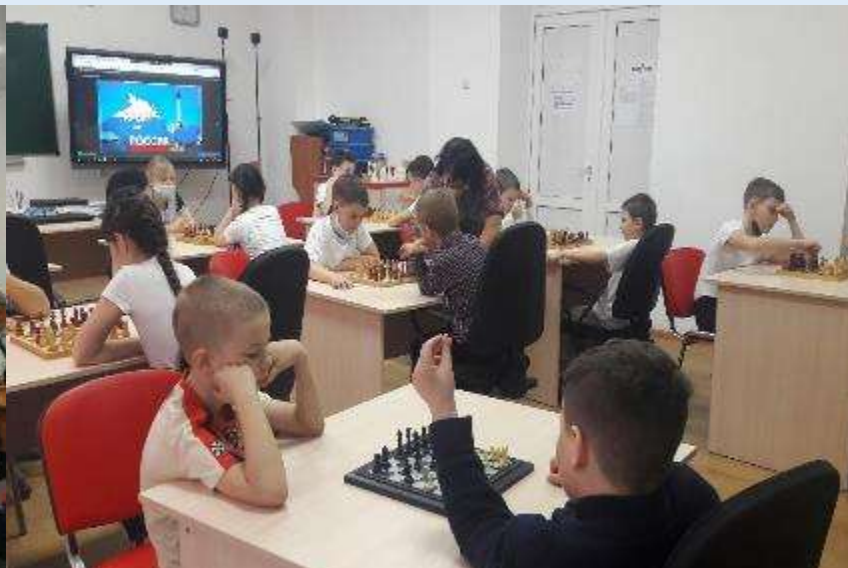
СОШ № 5 г. Новопокровский район