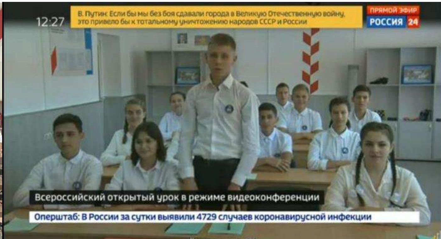
СОШ № 30 Крыловской район