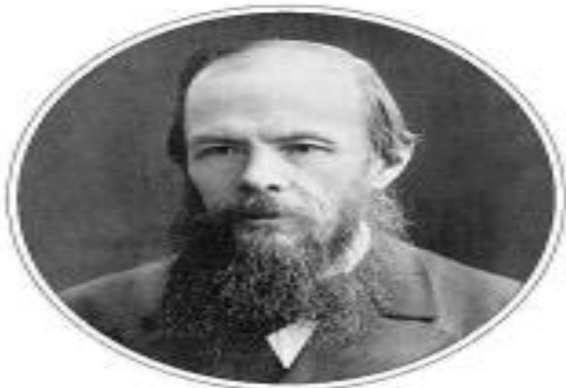
Федор ДОСТОЕВСКИЙ (1821-1881)

Родился - 11 ноября (30 октября по старому стилю) 1821 г. Умер - 9 февраля (28 января по старому стилю) 1881 г.