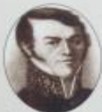
Ф. М. Достоевский, около 1824 года