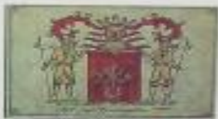
Грб рода Достоевских