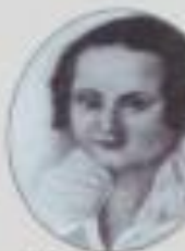
М. Ф. Достоевская, мать писателя

Фёдор Михайлович Достоевский родился в 30 октября (11 ноября) 1821 года в Москве. Отцом его был отставной военный доктор Михаил Андреевич Бухарин (Бухарестовский войны 1812 года), а матерью — Мария Фёдоровна (в девичестве Немчинова). Первым ребёнком в семье был Николай, а Фёдор — вторым. Всем именем братья были очень дружны.