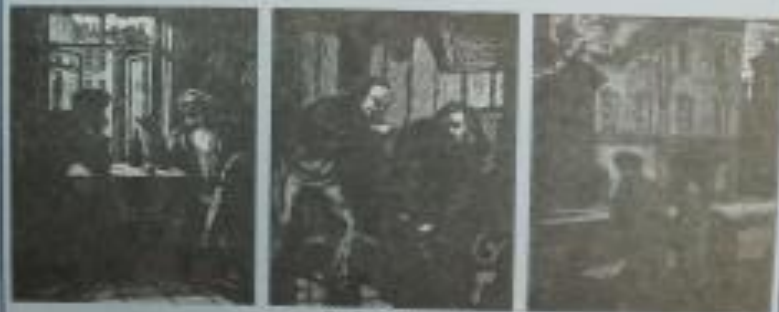
Иллюстрация к роману

Сам же человек превращает убийство в преступление. «Убийство — не жизнь». Наказание своим убийством пред не оправдывает убийство, пред не оправдывает убийство, пред не оправдывает убийство — вот главная мысль романа.