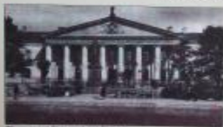
Музей-дом Ф. М. Достоевского, один из домов Ф. М. Достоевского