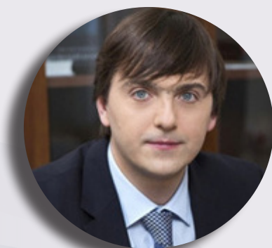
Сергей Кравцов Министр просвещения России

«Может быть архисовременная школа, с потрясающим дизайном, всё в этой школе есть. Но если в школе нет учителя – это не школа. Очень много, если не всё, в школе зависит от учителя. И моя мечта, чтобы учителя нашей страны были счастливы, чтобы они получали достойную зарплату. Престиж работы учителя, уважение к учителю – вот, наверное, самая главная моя мечта».