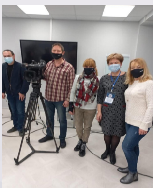
На базе ИРО предусмотрена запись уроков по ряду предметов

Педагоги в онлайн-формате помогут выпускникам 9 и 11 классов подготовиться к предстоящим эк-