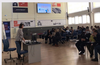
Семинар-тренинг для школьных команд, вышедших в полуфинал Всероссийского конкурса «Флагманы образования. Школа»

Образовательный семинар-тренинг для школьных команд, вышедших в полуфинал Всероссийского конкурса «Флагманы образования. Школа», прошел на базе Института развития образования.