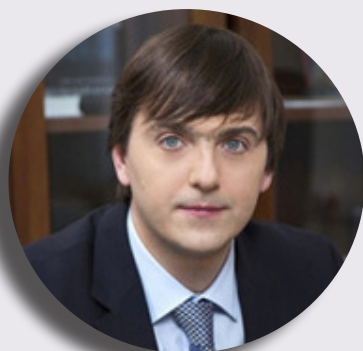
Сергей Кравцов Министр образования Российской Федерации

«Задача администраций сделать максимум для того чтобы педагоги чувствовали себя в максимально комфортной среде. Нужно ограждать их от бумажной волокиты, от излишних отчетов – учитель должен развиваться профессионально, должен иметь время на то чтобы построить интересный урок, вот в чем задача, еще раз призываю всех более чутко относиться к учителям».