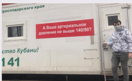
Профилактический осмотр сотрудников ИРО

Скрининговые обследования на предмет выявления у сотрудников факторов риска заболеваний сердечно-сосудистой системы провели специалисты мобильного Центра здоровья в Институте развития образования.