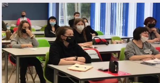
Курсы по подготовке участников конкурса «Учитель здоровья Кубани-2022»

Сегодня в Институте развития образования стартовали курсы по подготовке участников профессионального конкурса «Учитель здоровья Кубани-2022».