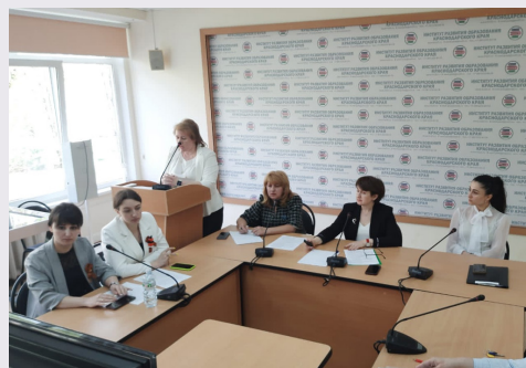
II межрегиональная научно-практическая конференция

Обсуждение путей и средств формирования естественнонаучной грамотности младших школьников стало центральной темой II межрегиональной научно-практической конференции, которая прошла в Институте развития образования в гибридном очно-заочном формате. Проблематика конференции особенно актуальна с учетом приоритетных направлений развития отечественного общего образования и требований обновленного ФГОС НОО.