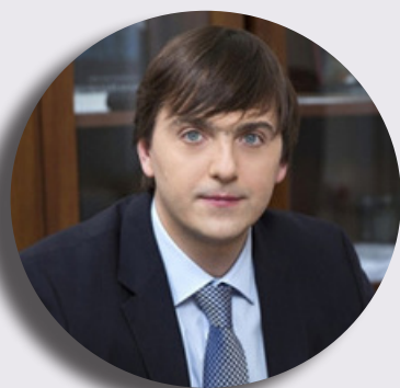
Министр просвещения Сергей Кравцов

«Воспитание подрастающего поколения приобретает стратегическое значение и становится гарантом национальной безопасности. Воспитывая и развивая детей, нам есть на что опираться: богатое культурное наследие нашей страны, нашу выдающуюся педагогическую школу, методики и технологии, которые используются во всем мире».