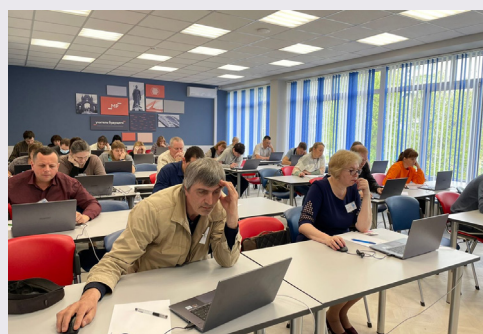
Олимпиада среди учителей информатики, проходящая в рамках II Всероссийских профессиональных олимпиад

Олимпиада для учителей уже доказала свою востребованность как еще одного инструмента профессионального развития педагогов – в 2021 году в конкурсных испытаниях приняли участие в общей