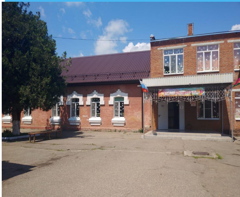
Муниципальное казенное общеобразовательное учреждение средняя общеобразовательная школа № 4 имени Я. И. Кунцына муниципального образования Усть-Лабинский район