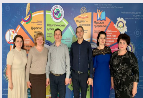
Участники Сообщества учителей физики»

На основе анализа анкетирования Совета краевого сообщества были сформулированы пути решения выявленных проблем, волнующих учителей фи-