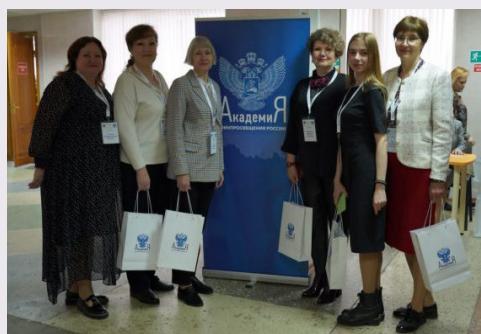
Команда Краснодарского края на стажировке в Липецке

Совместно с учителями общеобразовательной школы № 4 в Лабинске специалисты кафедры психологии, педагогики и дополнительного образования ИРО провели выездную стажировку для замести-