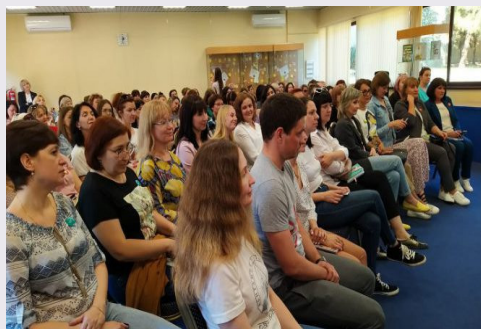
Открытие Фестиваля мастер-классов