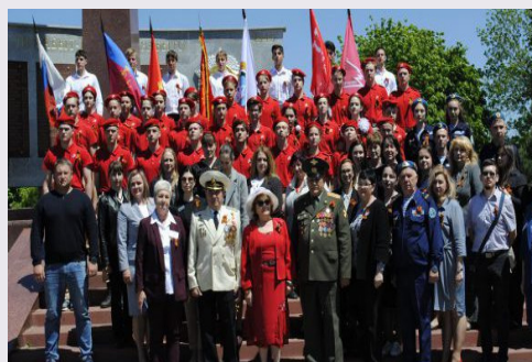
Делегация ИРО и учителя лабинской школы № 4

телей школьных директоров по воспитательной работе и классных руководителей. Тема – «Система военно-патриотического воспитания в образовательной организации как средство формирования духовно-нравственных качеств личности». Представители 14-ти муниципалитетов приняли активное участие в работе стажировочной площадки.