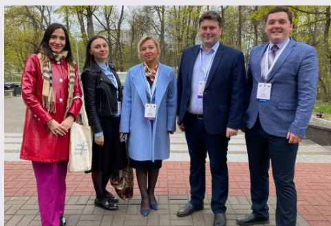
Делегация педагогов Краснодарского края

В Санкт-Петербурге прошел Всероссийский форум молодых педагогов «Педагог: Профессия. Призвание. Искусство», учредителем которого является Минпросвещения РФ. В форуме приняли участие более 200 молодых педагогов из 70 регионов всех восьми федеральных округов России – победители, призеры и лауреаты профессиональных олимпиад и конкурсов, в том числе Всероссийского конкурса «Учитель года России», представители молодежных общественных педагогических организаций, председатели советов молодых педагогов региональных (межрегиональных) организаций Общероссийского Профсоюза образования.