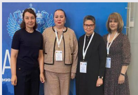
Управленцы ИРО на стажировке в Екатеринбурге

Как организовать процесс подготовки к введению обновленных ФГОС начального общего и основного общего образования в общеобразовательных организациях? На этот и другие вопросы отвечали участники вебинара из цикла «Методический горизонт», посвященному особенностям процесса подготовки к