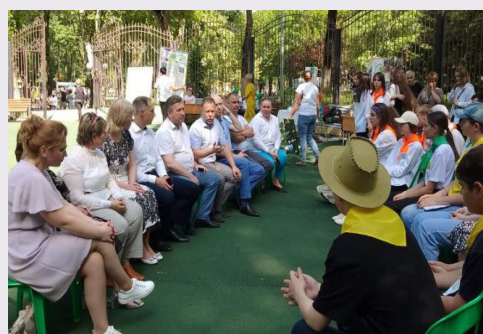
Церемония награждения конкурса «Лучший Детский экологический совет»