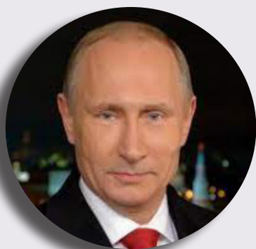
Президент Российской Федерации Владимир Путин

«Воспитание детей не должно быть для «галочки», важно заряжать их искренностью, эмоциями, учитывая культурное многообразие регионов».