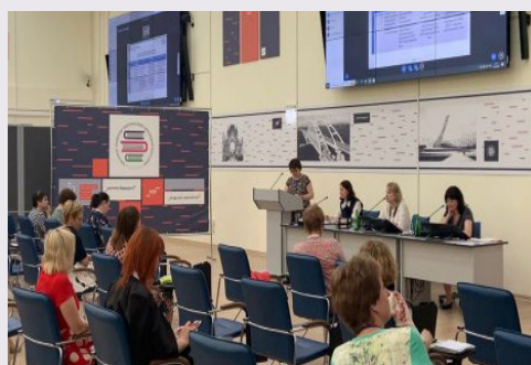
Заседание Ученого совета ИРО