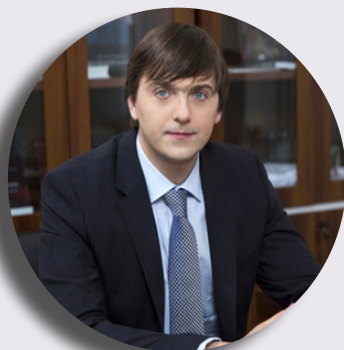
Министр просвещения Сергей Кравцов

«Мы никогда не откажемся от традиционной системы обучения. Наш принцип – сохранение классического образования, общения учителя и ученика, потому что образование – это еще и воспитание. Воспитание нравственных ценностей, гражданина, патриота нашей страны».