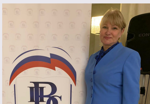
Т.А. Гайдук, ректор Института развития образования Краснодарского края

Очередной семинар «Вектор образования: вызовы, тренды, перспективы», прошедший на дистанционной площадке Академии Минпросвещения России, был посвящен русскому языку и культуре речи