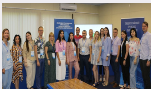
Съезд Регионального сообщества молодых преподавателей Краснодарского края

В рамках съезда обсуждались перспективы развития сообщества молодых преподавателей и мероприятия на предстоящий год. На заседании Совета рассматривались программы государственной поддержки молодых педагогов, особенности реализации публикационной деятельности, проблемы патриотического воспитания в учебных заведениях, а также