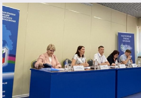
Семинар-совещание в Геленджике

Три дня руководители всех муниципальных органов управления образованием общались с первыми лицами краевой системы образования, лидерами отраслевого профсоюзного движения, работали над актуальными проблемами современного образования, обсуждали стратегические направления его развития.