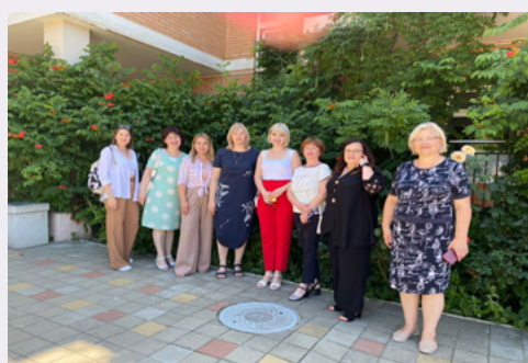
Лауреаты Всероссийского конкурса в культурно- образовательном туре

Культурно-образовательный тур по лучшим детским садикам Новороссийска, Геленджика и Кабардинки – такой подарок сделал Краснодарский край лауреатам Всероссийского профессионального конкурса «Воспитатель года России-2021».