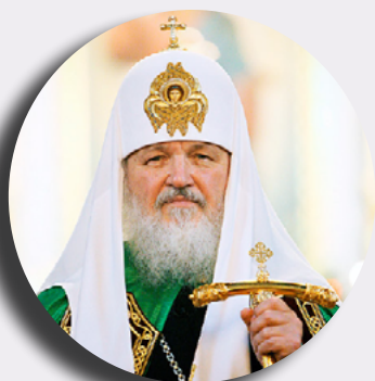
Святейший Патриарх Кирилл

«Образование призвано передавать человеку знания предыдущих поколений, потому что все знания принадлежат прошлому. Образование есть вхождение в традицию или, как мы говорим, церковные люди, предание».