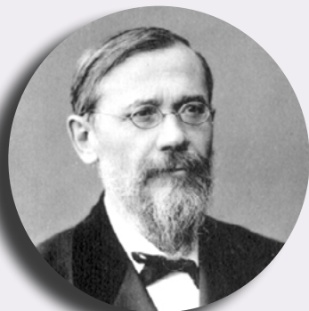
российский ученый Василий Ключевский

«Чтобы быть хорошим преподавателем, нужно любить то, что преподаешь, и любить тех, кому преподаешь».