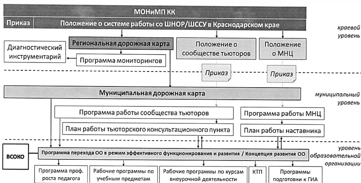
Рисунок 2 – Нормативная модель сопровождения школ с низкими образовательными результатами и/или школ, функционирующих в сложных социальных условиях в Краснодарском крае

Деятельность и взаимодействие субъектов краевой системы образования по сопровождению школ с низкими образовательными результатами и/или школ, функционирующих в сложных социальных условиях, осуществляется в рамках специально созданной нормативной базы. Документационное обеспечение реализации Системы в Краснодарском крае приведено на рисунке 2.