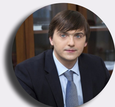
Министр просвещения Российской Федерации Сергей Кравцов

«Безусловно очень важно продолжить совершенствовать качество образования, сделать все, для того чтобы детям действительно было интересно учиться и постигать новое. Определяющую роль в этом играет учитель, который создает комфортную для детей атмосферу, поддерживает их в преддверии наступающего нового учебного года».