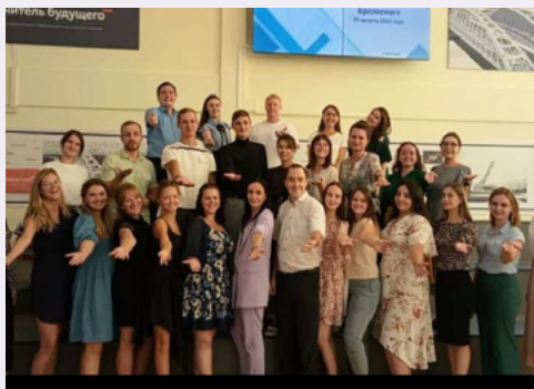
Участники площадки «Молодой учитель»

Для ребят самое любимое место для тренировок и активного отдыха – ДОЛ «Морская волна», где для спортивных занятий предусмотрены различные