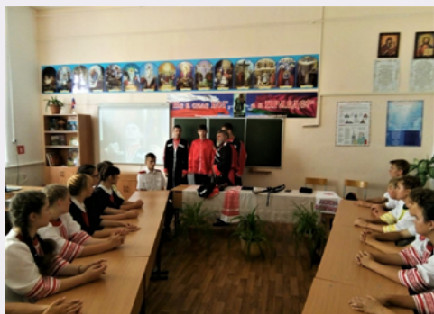
Открытие августовской конференции