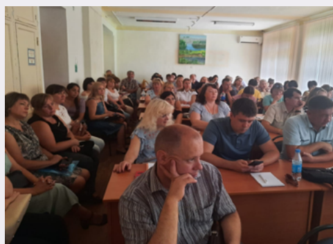
Учителя истории на фестивале мастер-классов

В рамках мероприятия прошел ряд мастер-классов учителей истории из разных муниципалитетов.