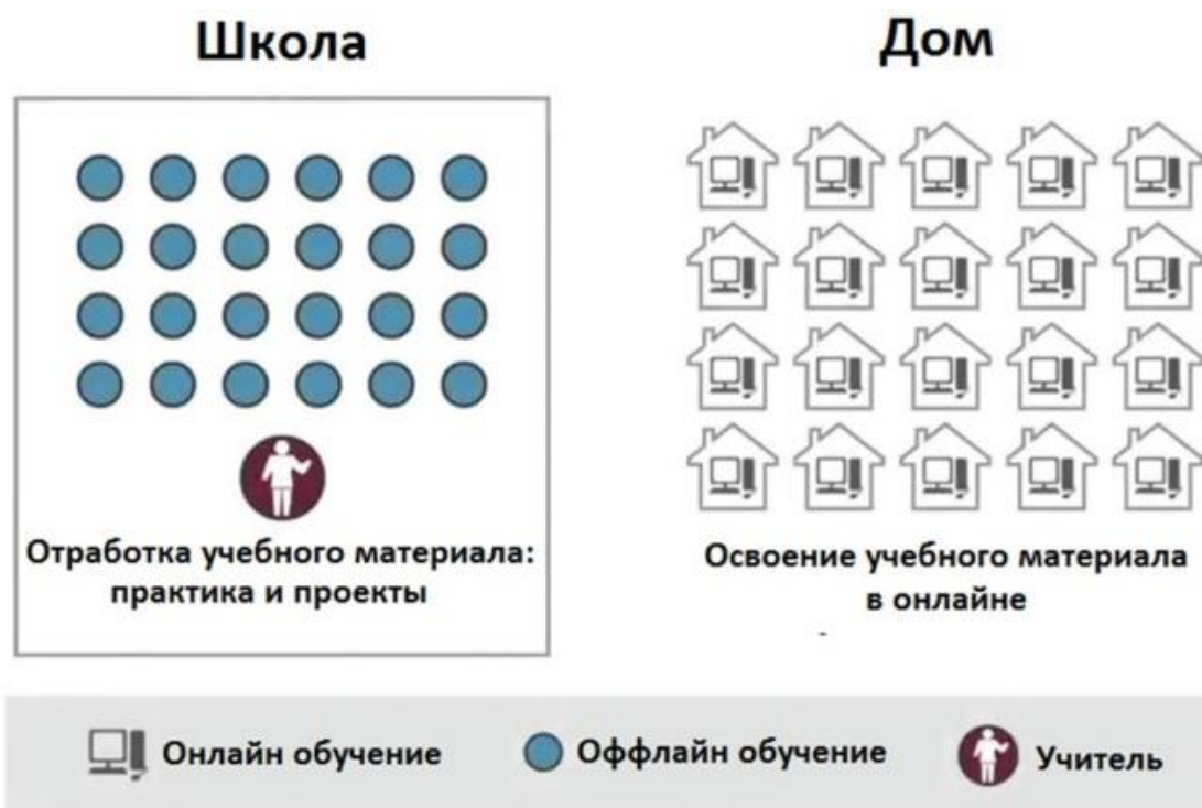
Рисунок 2. Модель «Перевернутый класс»

Кроме перечисленных моделей смешанного обучения, хорошо зарекомендовали себя в региональной практике реализации федерального проекта «Развитие дистанционного образования детей-инвалидов» (2009-2013гг.) модели «Межшкольная группа» на муниципальном уровне и модель «Индивидуальный учебный план».