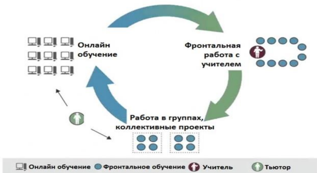
Рисунок 3. Модель «Ротация станций»

Кроме перечисленных моделей смешанного обучения, хорошо зарекомендовали себя в региональной практике реализации федерального проекта «Развитие дистанционного образования детей-инвалидов» (2009-2013гг.) модели «Межшкольная группа» на муниципальном уровне и модель «Индивидуальный учебный план».