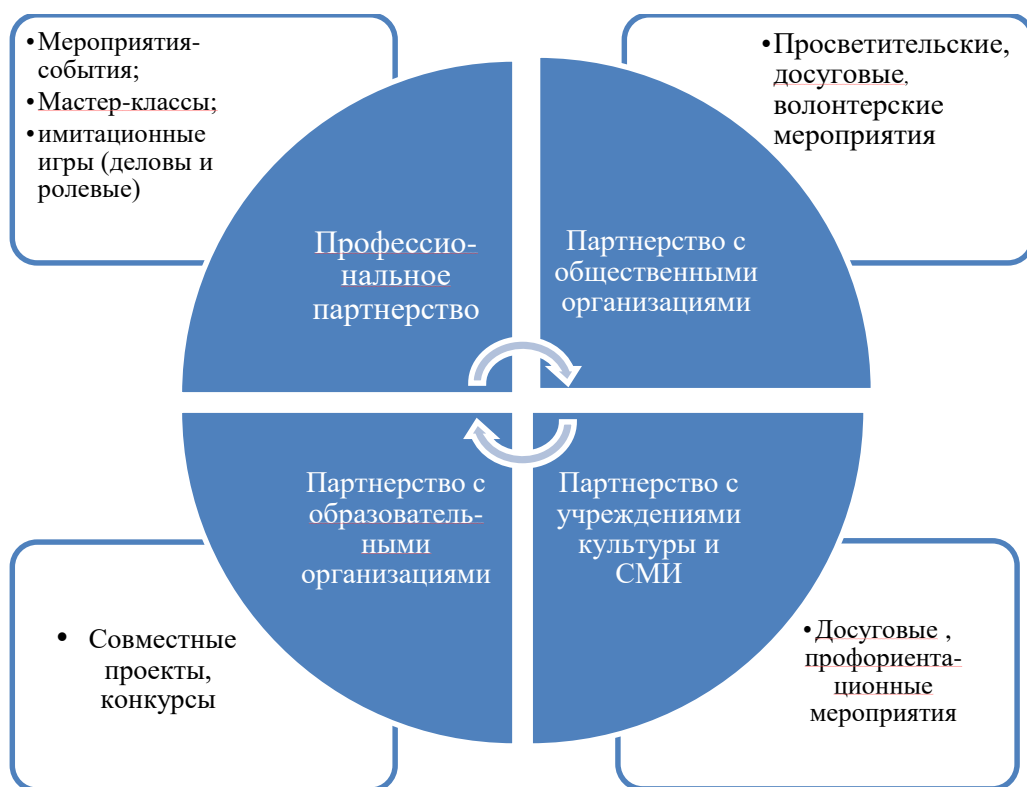
Рисунок 1 – Методические базовые модули подсистемы проекта.

– участие в реальной деятельности (мастер-классы, совместные проекты, конкурсы).