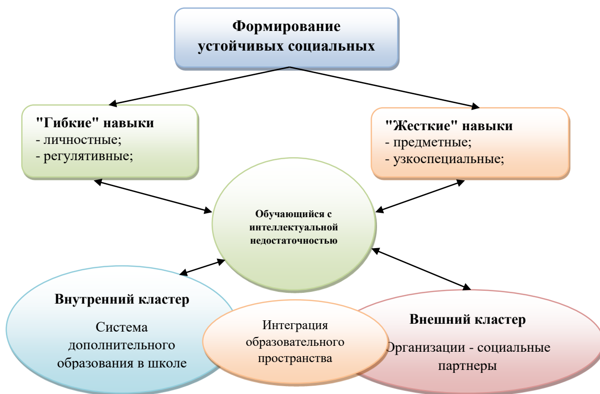
Рисунок 2 – Интеграция образовательного пространства как основное условие формирования социальных навыков обучающегося с интеллектуальными нарушениями.

Разнообразным образовательное пространство «особого» школьника можно сделать, только усиливая модель развития «гибких» навыков и посредством включения в систему ДО взаимодействия с различными организациями – социальными партнерами. При этом важно, чтобы у всех участников образовательного процесса было единое понимание того, на какие результаты направлено обучение, поскольку разные результаты требуют разных форматов обучения, разной длительности обучения и разных практик взаимодействия со школьниками. Важно отметить, что разные тематические направления и предметные блоки дополнительных занятий нельзя однозначно относить к той или иной модели или роли ДО – модели развития «гибких» навыков, модели развития «жестких» навыков или к компенсирующим занятиям.