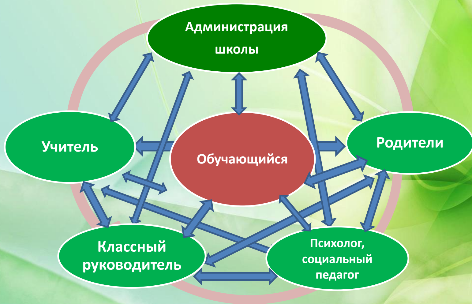
Схема работы школы по предупреждению неуспеваемости