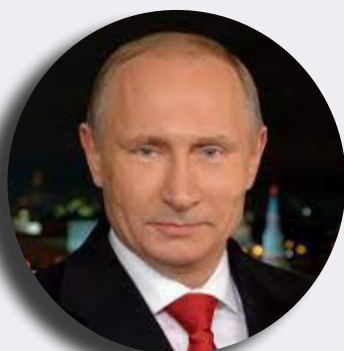
президент Российской Федерации Владимир Владимирович Путин

«Сейчас, на поворотном этапе развития всего мира, нужно укреплять и выстраивать национальную систему образования и воспитания, обеспечить единство образовательного пространства».