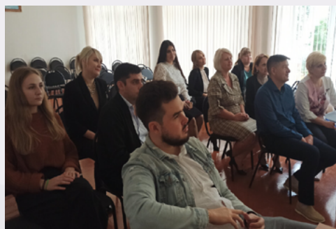
Мастер-класс по обмену опытом