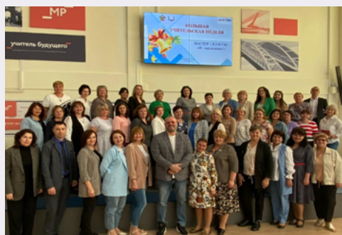
Участники мастер-классов для наставников

На фестивале мастер-классов педагоги делились опытом по реализации проблемного обучения без лишнего формализма.