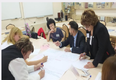
Конкурс методических команд

В ИРО подвели итоги краевого конкурса муниципальных команд: