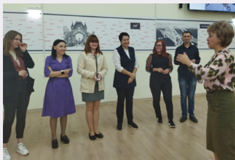
Семинар для педагогов естественнонаучных дисциплин

Прошел краевой семинар по формированию функциональной естественнонаучной грамотности.