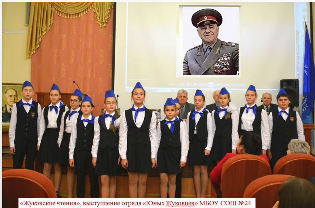
«Жуковские чтения», выступление отряда «Юных Жуковцев» МБОУ СОШ №24