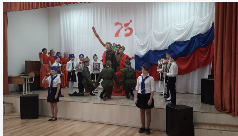
Мероприятие, посвященное 23 февраля.