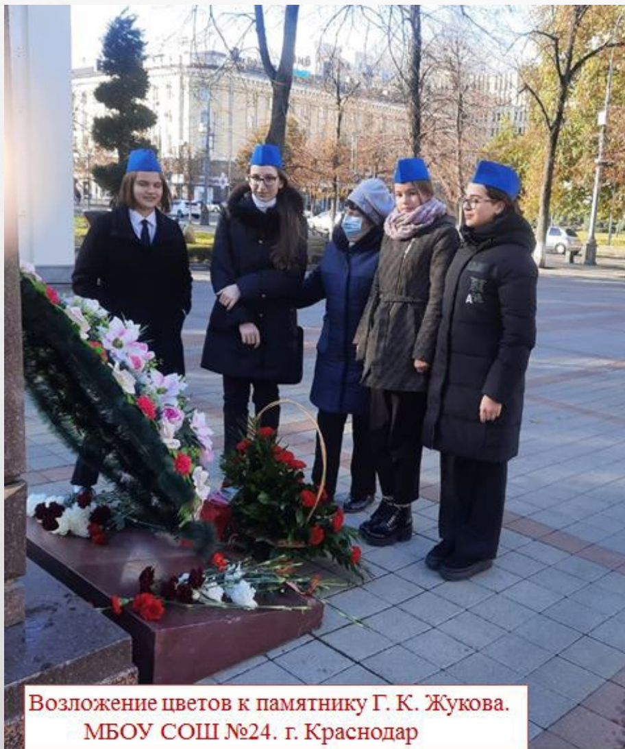
Возложение цветов к памятнику Г. К. Жукова. МБОУ СОШ №24. г. Краснодар