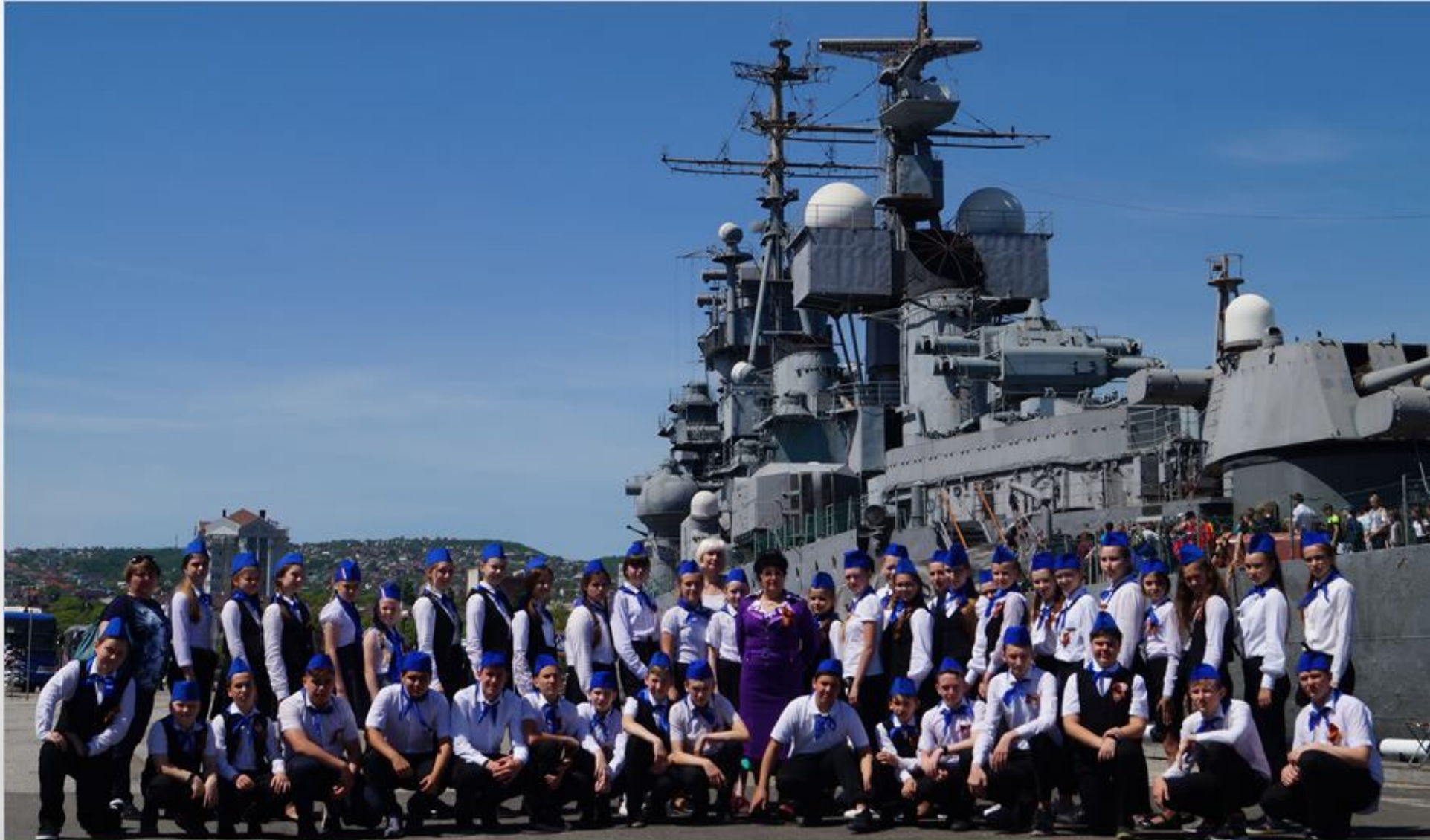
Экскурсия «Дороги Победы» в рамках всероссийской военно-патриотической программы. МБОУ СОШ №24, г. Новороссийск