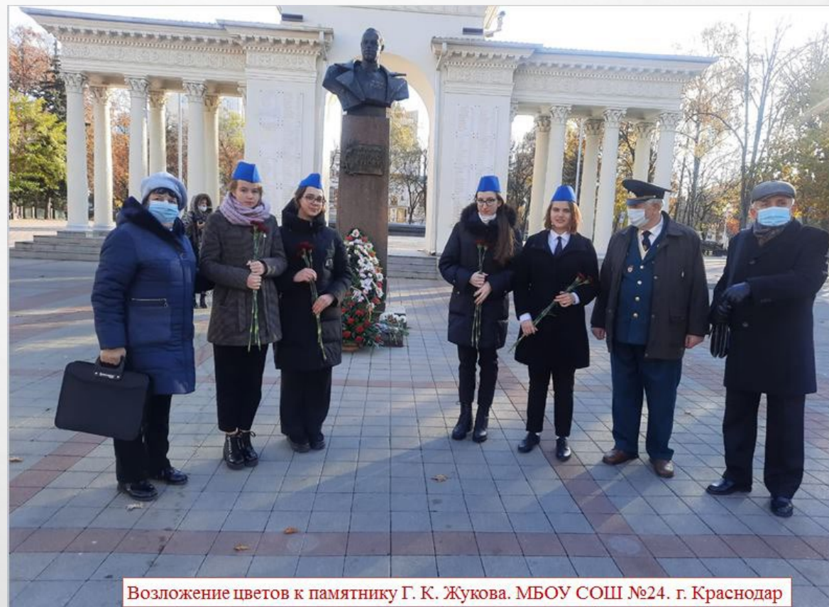
Возложение цветов к памятнику Г. К. Жукова. МБОУ СОШ №24. г. Краснодар