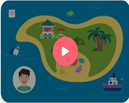
Деньги и экология