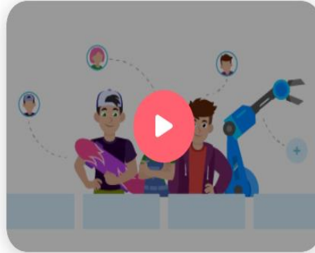
Доходы и расходы

Обучение построено на выполнении интерактивных заданий, которые соответствуют школьной программе. Задания моделируют ситуации из реальной жизни, знакомые каждому ребенку.