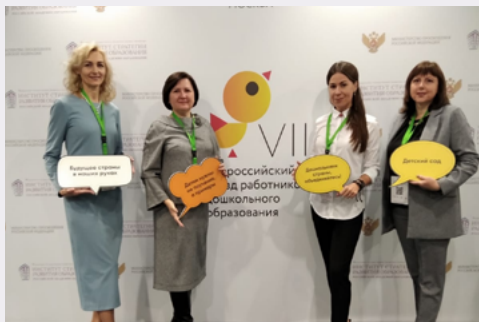
Съезд работников дошкольного образования

Слушатели рассмотрели урок математики и его особенности, обсудили требования к современному уроку в соответствии с обновленным ФГОС, проговорили подготовку учителя к уроку, отбор содержания, выбор методов и организационных форм обучения как индивидуальных, так и групповых, коллективных. Педагоги начальной школы гимназии представили практический материал для обсуждения и анализа способов формирования у учащихся матема-