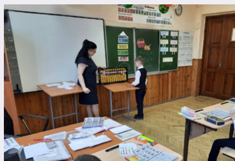
Стажировочная площадка для учителей математики