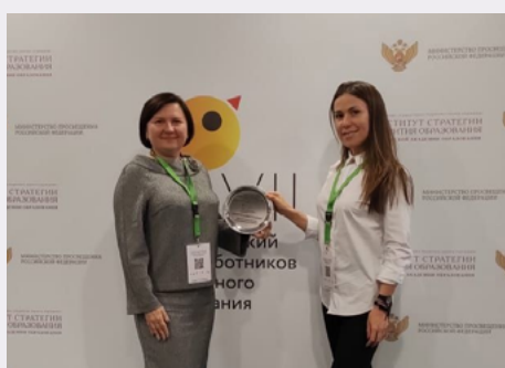
Сотрудники кафедры дошкольного образования

По итогам голосования Краснодарский край победил в номинации «Образовательная среда для ребенка дошкольного возраста».