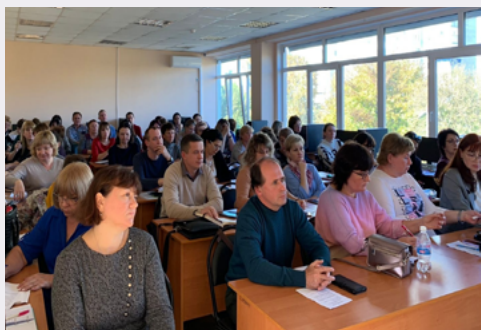
Участники "Школа тьюторов"

сударственному экзамену и единому государственному экзамену по истории, информатики и ИКТ, обществознанию, иностранному языку, географии, химии, биологии, а также руководителей районных методических объединений и тьюторов ГИА, курирующих в муниципальном образовании деятельность педагогических работников по подготовке обучающихся к ОГЭ и ЕГЭ.