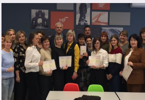
Сессия "Идеальная Российская школа"

Команды попытались операционализировать единое образовательное пространство под каждое из направлений, подготовив конкретные виды активности, необходимые для реализации в каждой образовательной организации.