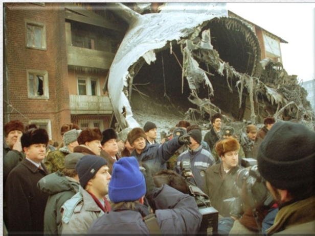
Авиакатастрофа АН-124 «Руслан»