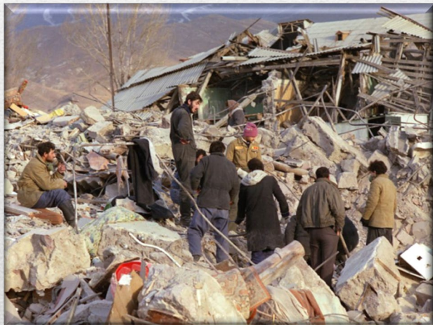
Землетрясение в Спитаке (респ. Армения)