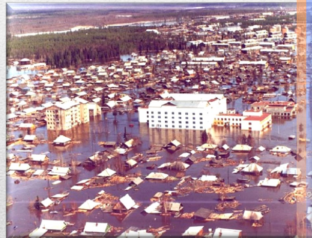
Наводнение в г. Ленске (респ. Саха (Якутия))