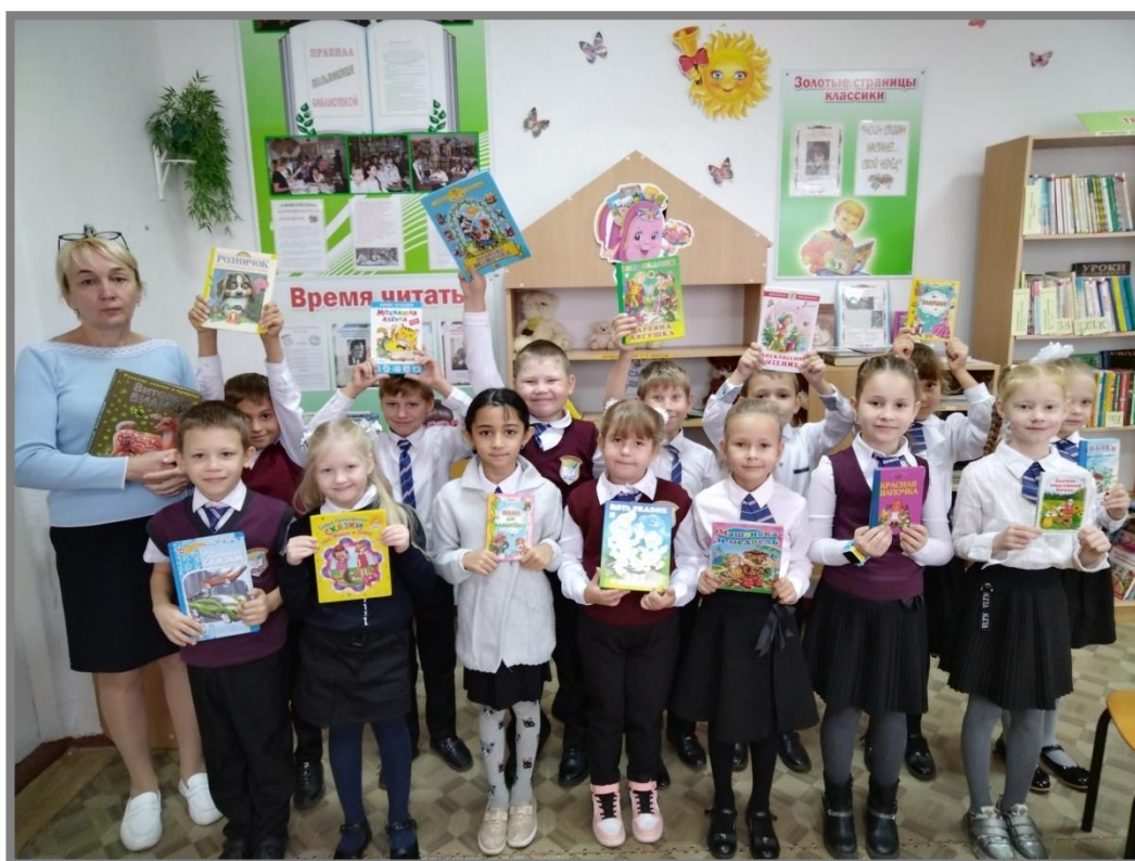
Библиотечный урок в 1 классе. «Каждый должен разбираться, как же с книгой обращаться»