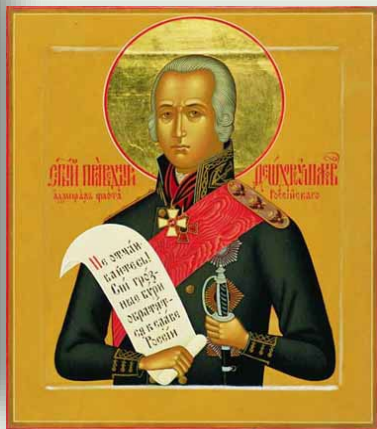
Икона Праведного Воина Федора Ушакова