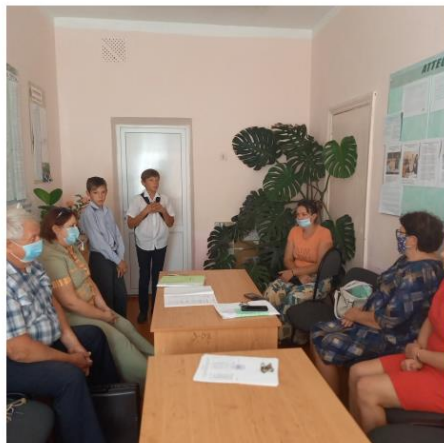
Дорожная карта антирисковых мер