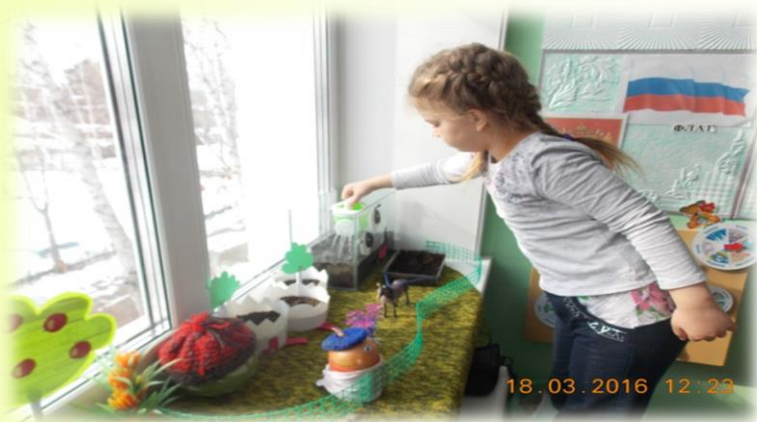
Первые опыты выращивания рассады