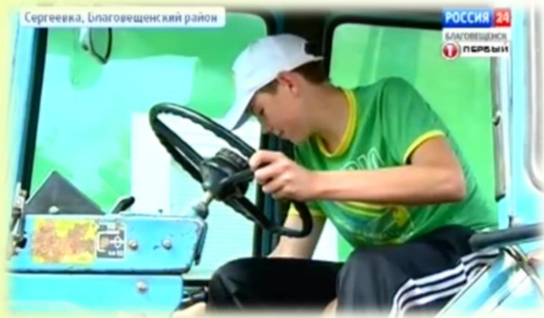
Профессия «Тракторист-машинист категории В С Е