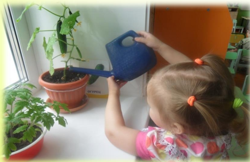
Проект «Огород на подоконнике»