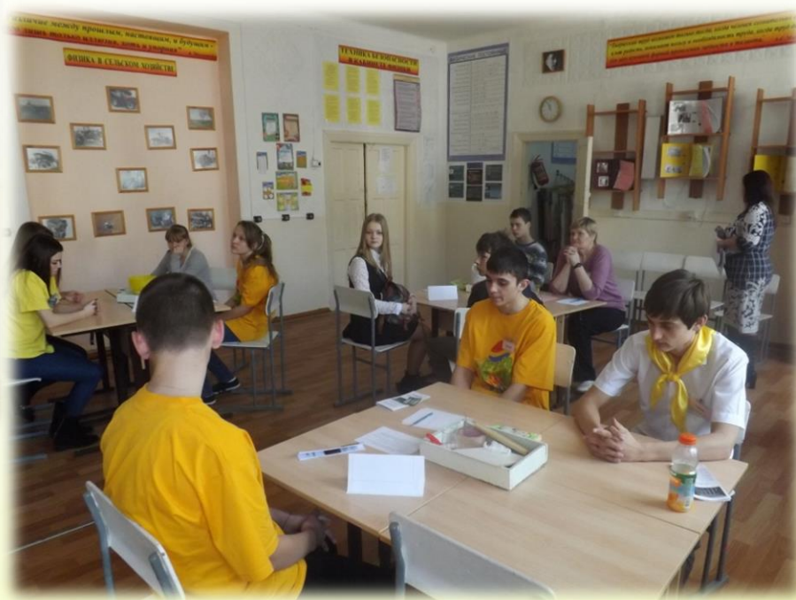
Игра «Дальневосточный гектар»