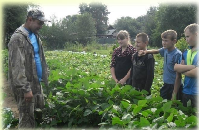
Опыты под руководством агронома КФХ