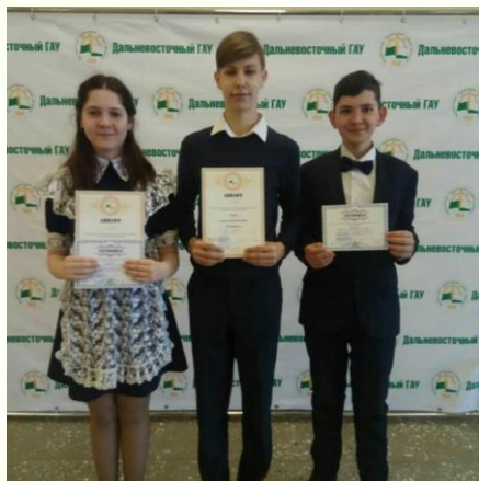
Конференция ДальГАУ «Юные исследователи»