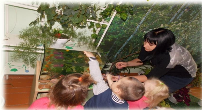
Проект «Золотая рыбка»