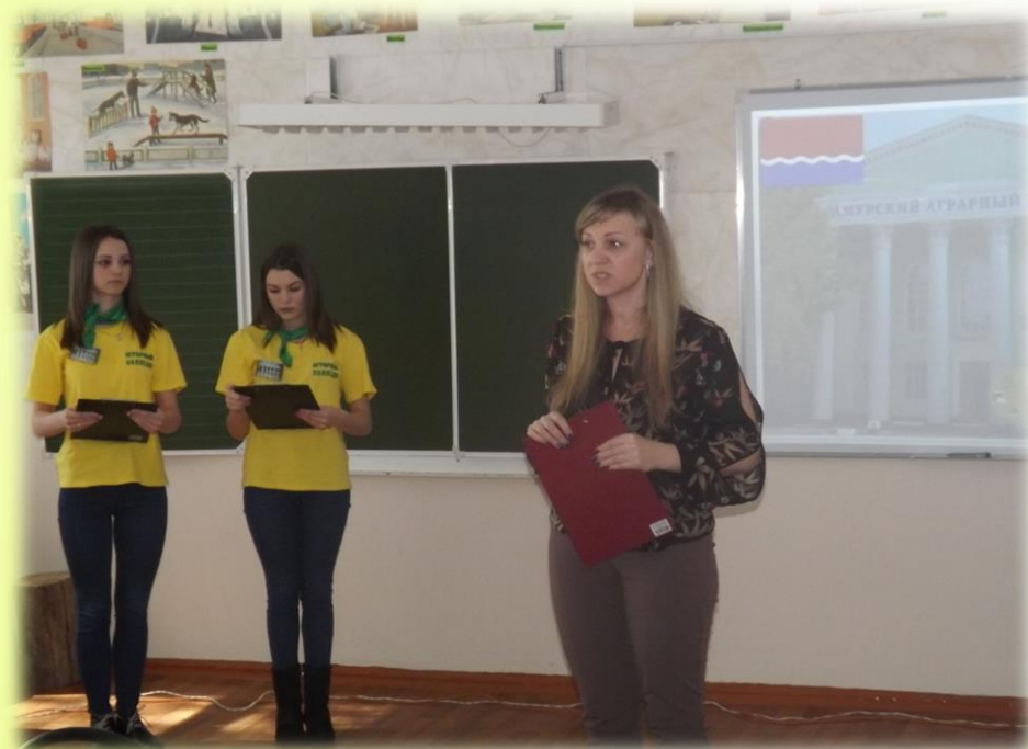
Реклама Аграрного колледжа