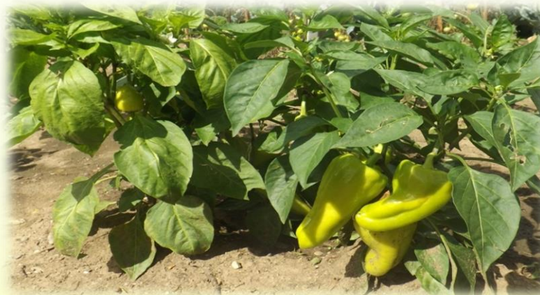
Опыты пришкольного участка