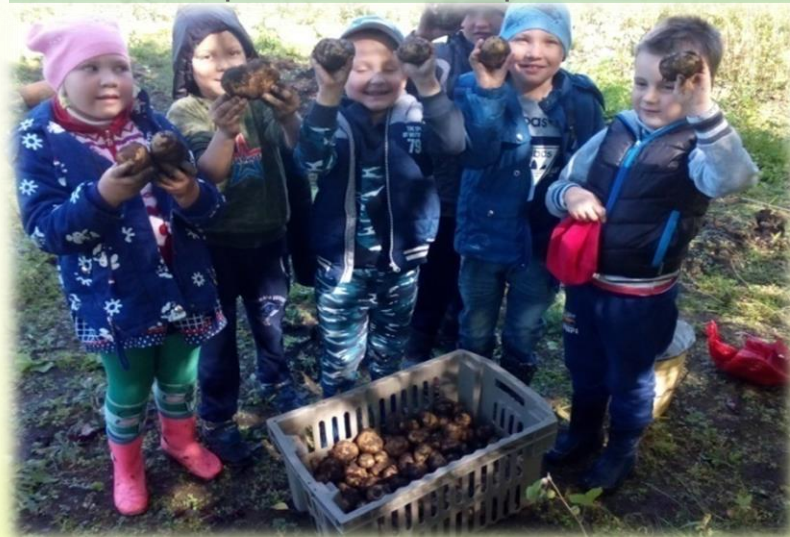
Урожай с УОУ детского сада