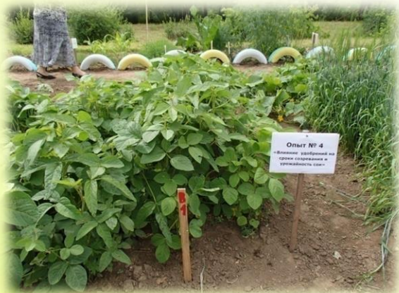
Опыты по руководством преподавателей ДальГАУ