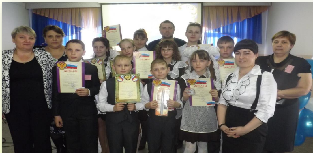
Конференция «Поиск и творчество»