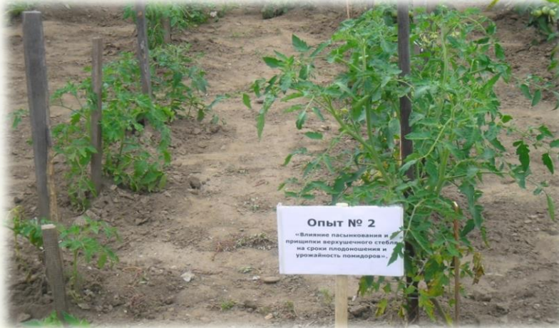
Опыты по руководством эколого-биологического центра