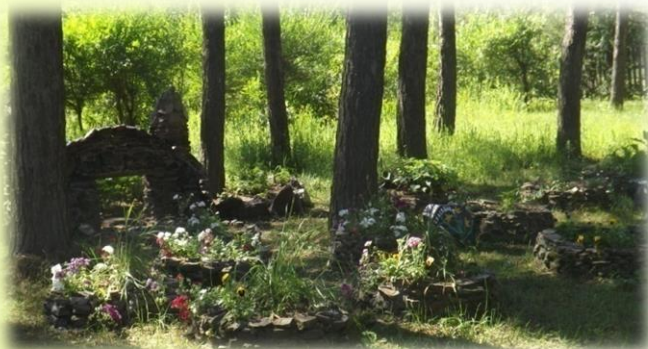
Клумба непрерывного цветения