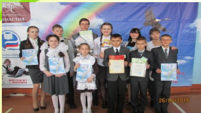
Областная конференция «С чего начинается Родина»