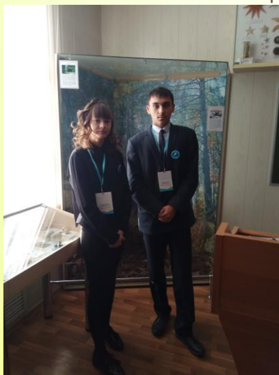
Экологический форум «Живи, Земля»