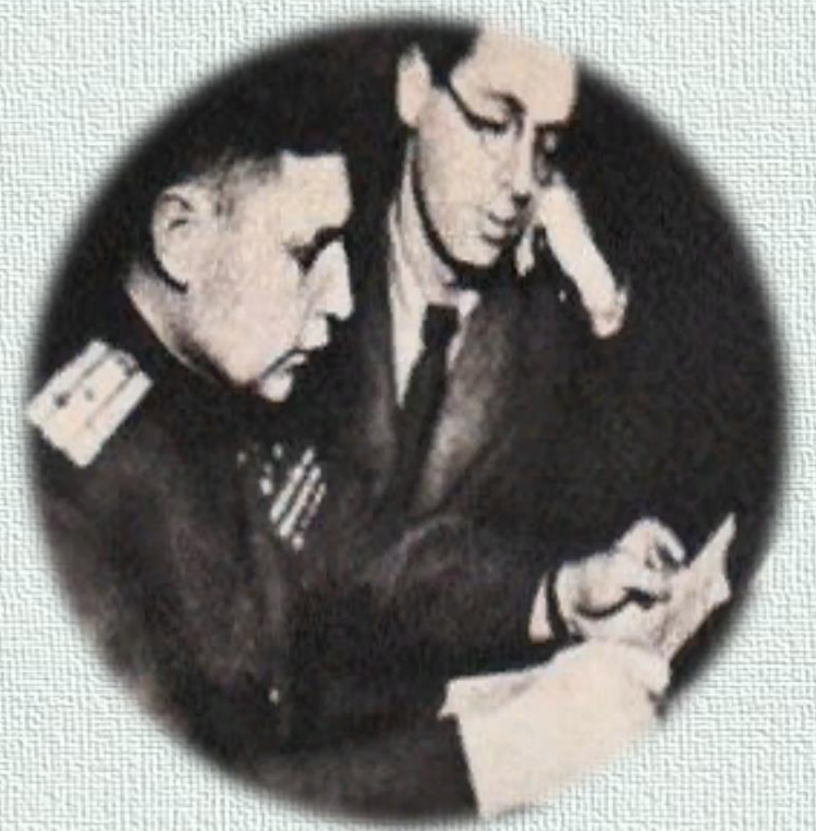
А. И. Покрышкин в день награждения третьей звездой Героя в студии Всесоюзного радио с Ю. Б. Левитаном.

19 августа 1944 года, после 550 боевых вылетов и 53 официальных побед, Покрышкин был награждён Золотой Звездой Героя Советского Союза в третий раз. Он стал первым трижды Героем Советского Союза в стране. Журнал «Смена» назвал Александра Покрышкина «лучшим лётчиком Советской страны», поместив его портрет на обложку августовского выпуска. В 1944 году участвовал в воздушном сражении в районе Ясс, в Львовско-Сандомирской операции (в ней одержал 2 последние официально засчитанные ему победы), прикрывал с воздуха наземные части на Сандомирском плацдарме. В 1945 году полковник А. И. Покрышкин командовал дивизией в ходе Висло-Одерской, Нижне-Силезской, Верхне-Силезской, Берлинской и Пражской наступательных операций. Дивизия под командованием А. И. Покрышкина получила почётное наименование «Берлинская» и была награждена тремя орденами. Сам Покрышкин последний боевой вылет выполнил 30 апреля 1945 года. Участвовал в параде Победы 1945 года как знаменосец 1-го Украинского фронта.