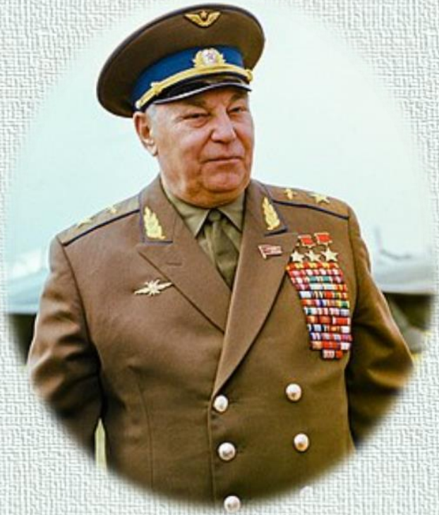
Маршал авиации А.И. Покрышкин, 1978 год

«ЧТОБЫ СООБРАЖАТЬ В ВОЗДУХЕ, НАДО ГОТОВИТЬСЯ К ЭТОМУ НА ЗЕМЛЕ» — ОДНО ИЗ ПРАВИЛ А.И. ПОКРЫШКИНА