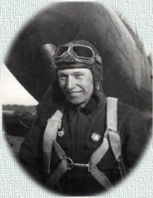
А. И. Покрышкин на Кубани. А. И. Покрышкин стоит, улыбаясь, на фоне самолета.

В Красной Армии с 17 июня 1932 года, доброволец. Был направлен в 3-ю Пермскую авиационную школу авиатехников, которую окончил в 1933 году. Затем учился на курсах усовершенствования технического состава ВВС Красной Армии имени К. Е. Ворошилова при 1-й военной школе авиатехников в Ленинграде, которые окончил в 1934 году. В декабре 1934 года Покрышкин стал старшим авиационным техником авиазвена связи 74-й стрелковой дивизии Северо-Кавказского военного округа и оставался в этой должности до ноября 1938 года. В этот период он предложил несколько улучшений к пулемёту ШКАС и к ряду других элементов вооружения. 1936—1938 годах Покрышкин обучался в Краснодарском аэроклубе мастерству лётчика без отрыва от основного места службы. Во время отпуска зимой 1938 года он втайне от начальства прошёл всего за 17 дней годовичную программу гражданского пилота. Это помогло ему добиться в ноябре 1938 года направления на учёбу в Качинскую Краснознамённую военную авиационную школу имени А. Ф. Мясникова, которую он окончил с отличием в ноябре 1939 года.