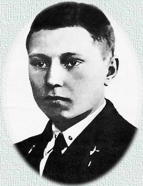
Младший техник-лейтенант Покрышкин А. И. – курсант Авиатехнического училища.

Тяжёлое детство не помешало Александру с ранних лет много времени уделять учёбе. По характеру он выделялся ярко выраженными лидерскими качествами и постоянным стремлением к учёбе. Покрышкин увлёкся авиацией в возрасте 12 лет, наблюдая полёты первых самолётов, после чего начал заниматься в авиамodelьном кружке. В 1928 году, после окончания семилетней школы, он пошёл работать на стройку вместе с отцом и дядей. В 1930 году, после конфликта с отцом, Александр покинул дом и поступил в местное техническое училище, где проучился 18 месяцев по специальности слесаря-лекальщика. Затем учился в вечернем институте сельскохозяйственного машиностроения и одновременно работал слесарем-инструментальщиком на заводе «Сибкомбинатстрой», тогда же увлекался изобретательством и за успехи в этом деле получил несколько дипломов. В 1931 году вступил в комсомол.