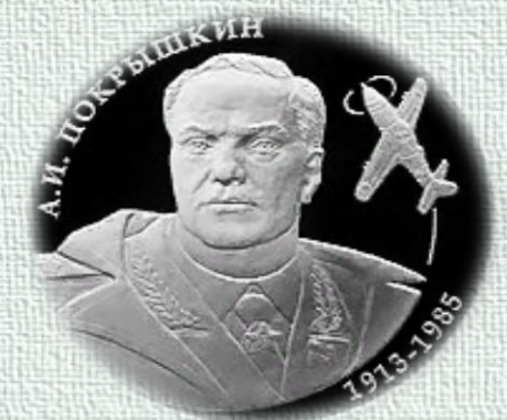
Памятная монета Банка России, посвящённая 100-летию со дня рождения А. И. Покрышкина. 2 рубля, серебро, 2013 год