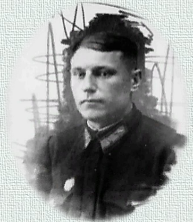
Капитан А. И. Покрышкин. 1942 г.

К середине ноября 1941 года выполнил 190 боевых вылетов, в том числе подавляющее большинство — 144 вылета — на штурмовку наземных войск врага. В июне—декабре 1941 года сбил два немецких самолёта лично и один — в группе. Продолжал воевать на Южном фронте в составе того же 55-го истребительного авиаполка. «За образцовое выполнение боевых задач и проявленное при этом мужество и героизм личного состава» полк 7 марта 1942 года был переименован в 16-й гвардейский истребительный авиационный полк.