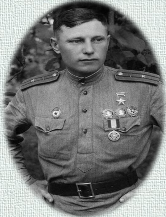
Командир эскадрильи Герой Советского Союза гвардии майор А.И. Покрышкин. Лето 1943 г.

Его новые тактические приёмы для патрулирования воздушного пространства, такие как «скоростные качели», «кубанская этажерка», и использование данных от наземных радаров, а также улучшенная наземная система контроля за воздушным пространством принесли советским ВВС первую большую победу над люфтваффе.