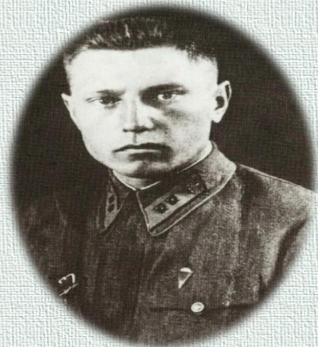
Покрышкин А. И. в молодости.

Одержав 3 июля ещё одну победу, он был подбит немецким зенитным орудием за линией фронта и четыре дня пробирался в свою часть. Во время первых недель войны Покрышкин, увидев, как устарела тактика советских ВВС, начал заносить свои идеи в записную книжку. Он аккуратно записывал все детали воздушных боёв, в которых участвовал он и его друзья, и делал детальный анализ. Ему приходилось сражаться в крайне тяжёлых условиях постоянного отступления. Участвовал в оборонительной операции в Молдавии, Тираспольско-Мелитопольской оборонительной операции, Донбасской оборонительной операции, Ростовской оборонительной операции и Ростовской наступательной операции. Зимой 1941 года Покрышкин, управляя МиГ-3, взлетел, несмотря на грязь и дождь, после того как двое других пилотов разбились, пытаясь взлететь.