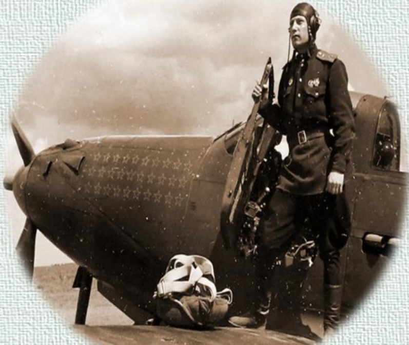
Александр Покрышкин во время войны.