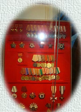
Награды А.И. Покрышкина