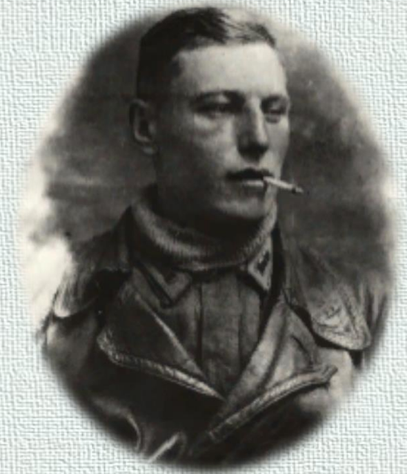
Покрышкин А. И. - заместитель командира эскадрильи, старший лейтенант.