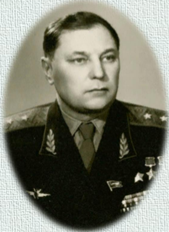
Генерал-лейтенант А.И. Покрышкин – Заместитель главнокомандующего войсками ПВО страны. Ленинград, 1968 г.

Американский журнал комиксов True Comics (в переводе с англ. — «Правдивые комиксы»), посвящённый сражениям на трёх фронтах Второй мировой войны, опубликовал в 45-м выпуске за 1945 год рассказ о полковнике Александре Покрышкине под названием «Ястреб небес». В июле 1945 года направлен на учёбу в академию. В 1948 году окончил Военную академию имени М. В. Фрунзе. После войны Покрышкин вызвал своим независимым характером раздражение Василия Сталина, тогда командовавшего ВВС Московского военного округа. В итоге этого полковник Покрышкин, назначенный на генеральскую должность ещё в 1944 году, сам стал генерал-майором авиации только после смерти Сталина, в августе 1953 года, и далее служил не в ВВС, а в Войсках ПВО. С января 1949 года — заместитель командира 33-го истребительного авиационного корпуса ПВО, с июня 1951 года — командир 88-го истребительного авиационного корпуса ПВО (переименован из 33-го иак ПВО в феврале 1949 года). С февраля 1955 года — командующий истребительной авиацией Северо-Кавказской армии ПВО. В январе 1956 года направлен на учёбу.