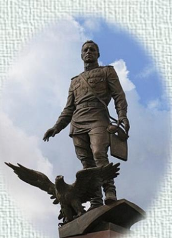
Памятник на площади Карла Маркса, Новосибирск