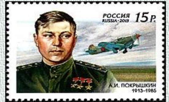
Почтовая марка России 2013 года