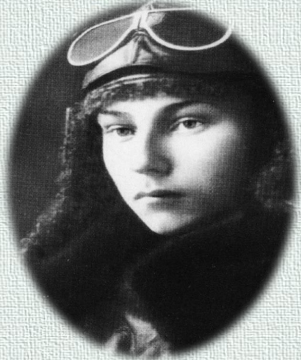
Александр Покрышкин. Пермь 1933 - 1940 гг.