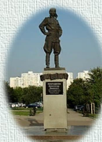
Памятник А. И. Покрышкину в Краснодаре