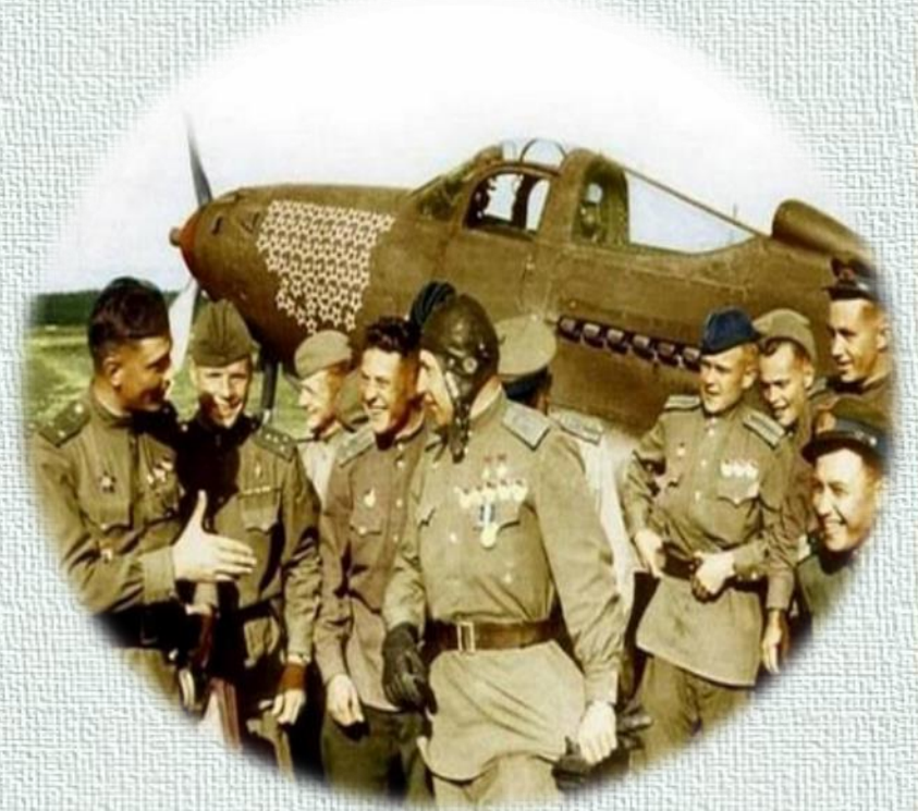
Поздравление А.И. Покрышкина с присвоением второй медали «Героя Советского Союза».

«За образцовое выполнение боевых заданий Командования на фронте борьбы с немецкими захватчиками, дающее право на получение звания Героя Советского Союза», Указом Президиума Верховного Совета СССР от 24 августа 1943 года гвардии майор Покрышкин Александр Иванович был награждён второй медалью «Золотая Звезда». Всего же в воздушной битве на Кубани с апреля по июнь 1943 года он сбил лично 22 самолёта врага, стали асами многие его ученики, а Покрышкин приобрёл всесоюзную славу. В июле 1943 года Александр Иванович присутствовал на Краснодарском процессе над пособниками немецких оккупантов. С ноября 1943 года — заместитель командира 16-го гвардейского истребительного авиационного полка. Кроме воздушных сражений на Кубани, в 1943 году участвовал в Миусской наступательной операции (2 победы), Донбасской наступательной операции (7 побед), Мелитопольской наступательной операции (1 победа) и в блокировании немецких войск в Крыму (5 побед). Именно 1943 год стал «звёздным часом» Покрышкина — в этом году он сбил лично 38 самолётов врага.