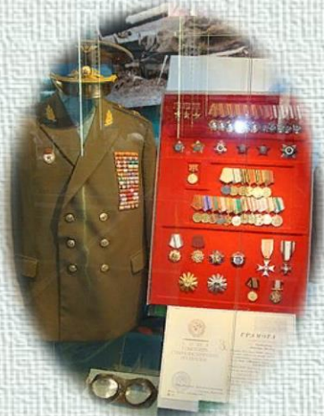
Парадный китель Покрышкина и его награды в Центральном музее Вооружённых Сил в Москве