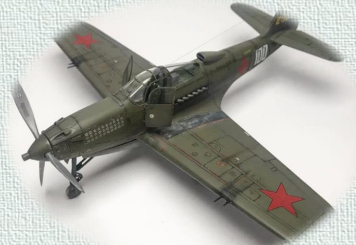
Белл Р-39 «Аэрокобра» — самолёт Покрышкина в 1943—1944 годах.

В 1942 году участвовал в Донбасской оборонительной операции, в оборонительном этапе битвы за Кавказ. За 1942 год сбил 1 немецкий самолёт лично и 1 — в группе (оба — июль-август). В январе 1943 года 16-й гвардейский авиаполк был послан за границу, в Иран, чтобы получить новую технику. 8 апреля лётчики-гвардейцы вернулись на фронт и сразу же включились в воздушные сражения на Кубани. 9 апреля 1943 года, во время первого же своего вылета на новом самолёте «Аэрокобра» с бортовым номером «100», с позывным «белая сотка», Покрышкин сбил Вф.109. В воздушных боях на Кубани против прославленных немецких истребительных авиасоединений А. И. Покрышкин проявил себя во всём блеске таланта умелого воздушного бойца и мастера тактики. За апрель 1943 года он сбил 10 немецких самолётов и был представлен к званию Героя Советского Союза.