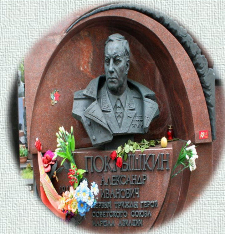
Могила А. Покрышкина на Новодевичьем кладбище.

В послевоенные годы написал несколько книг мемуарного жанра о Великой Отечественной войне, за что в 1965 году был принят в Союз писателей СССР. Скончался 13 ноября 1985 года в Москве на 73-м году жизни. Похоронен в Москве на Новодевичьем кладбище.