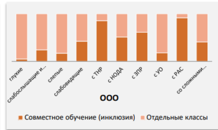
Распределение обучающихся разных нозологических групп по организационным формам образования (совместной, инклюзивной)