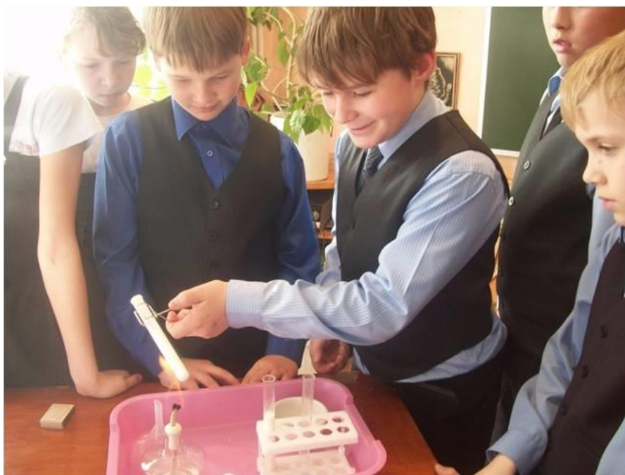
Рис.5. Изучаем состав молока

С особым интересом посещаем торговые предприятия: изучаем их ценовую политику в условиях конкуренции; составляем наборы продуктовых корзин для потребителей различных категорий; сопоставляя возможности и потребности, учимся оценивать собственные экономические действия в качестве потребителей. Не забываем и о том, что продукты, которые мы употребляем, должны быть экологически чистыми, качественными. С большим интересом проводим опыты и тестирование продуктов питания, учимся определять их сроки годности, наличие в них консервантов и красителей (рис.5).