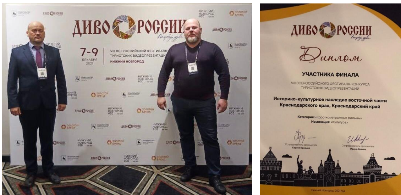
Рис.4,5. Участие в VIII Всероссийском фестивале-конкурсе туристских видеопрезентаций «ДИВО РОССИИ» (Г. Нижний Новгород, 2021 г.)