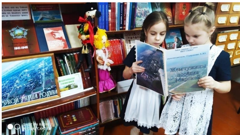
Рис. 3. Путеводитель по поселку «Пройдись по улицам Мирского»

Исследовательская работа интересна для учащихся младших классов. С удовольствием ребята готовят материалы к занятиям, беседуют со старожилами поселка, работают с экспонатами школьного музея. «Участие людей всех возрастов в такого рода собирании краеведческого материала имеет само по себе огромное воспитательное значение. Оно есть уже одной из акций патриотического характера, создающая в своем крае более высокий уровень духовной культуры», – писал академик Д.С. Лихачев. [2, с.160] И этому есть подтверждение. В рамках краевого конкурса «Жемчужины Кубани» мы подготовили материал о нашем поселке, где не только рассказали о нем, но и показали его достопримечательности. Эта работа полностью увлекла детей. Они с энтузиазмом собирали материал о своей малой родине. Нами был издан путеводитель по поселку «Пройдись по улицам Мирского», который занимает теперь почётное место в нашей школьной библиотеке (рис.3).