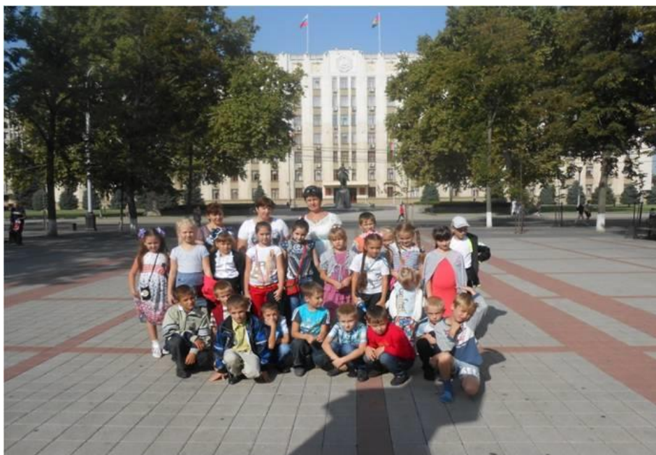
Рис.4. Экскурсия в Краснодар

Для младших школьников основными орудиями воспитания служат семья, школа и дополнительное образование. Именно такое сотрудничество и лежит в основе внеурочной деятельности «Кубанское подворье», которые я провожу по авторской программе по финансовой грамотности младших школьников, ставшей победителем всероссийского конкурса. Ужесточение Западом введённых санкций оказали негативное влияние на финансовую систему нашей страны. Государством разрабатываются программы по повышению финансовой грамотности населения, большое внимание уделяется развитию всех областей сельского хозяйства для обеспечения граждан собственными продуктами, отказа от импорта тех видов продукции, которую можно вырастить самим. И, если проблема финансовой грамотности касается всех граждан нашей огромной страны, то вторая приоритетная задача стоит, прежде всего, перед жителями сельских регионов. Мы живём в одном из самых благодатных уголков нашей страны – Краснодарском крае. Недаром его издавна называют «житницей России». Называют заслуженно, потому что каждая десятая буханка хлеба выпекается из кубанского зерна. Поэтому, кому как не нам, жителям Кубани, необходимо приложить все усилия для того, чтобы государственные программы по импортозамещению были выполнены. А решение этого вопроса неразрывно связано с финансовой грамотностью людей, работающих на земле.