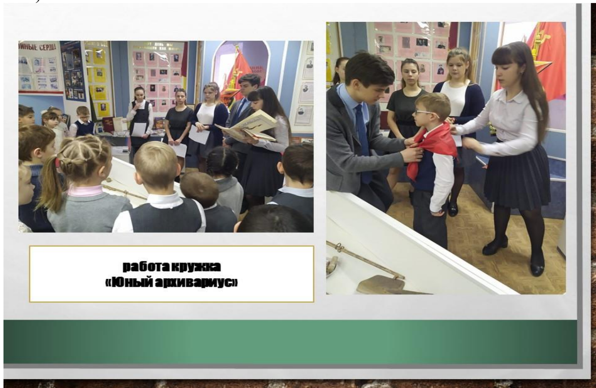
Рис.2 МОБУГ 2 им. И.С. Колесникова г. Новокубанска, 2022, работа кружка «Юный архивариус»

ния и всей структуре исследования. В гимназии музейная педагогика применяется в рамках курсов кружковой и внеурочной деятельности: «Юный архивариус», «История и культура кубанского казачества», «История и современность кубанского казачества», «Традиционная культура кубанского казачества» и др. (рис. 2).