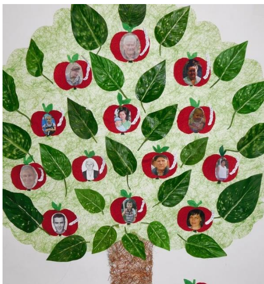
Рис. 1. Опыт использования элементов деятельностного подхода на уроках кубановедения, г. Армавир, 2023 г.

Серьезные учебные проекты с исследовательской составляющей мы с учениками начинаем выполнять уже во втором классе. Сезонный годовой исследовательский проект включает в себя фенологические наблюдения, творческие работы учащихся, анализ выборки небольших произведений кубанских писателей и поэтов, художников, изучение и отбор казачьих фольклорных произведений сезонной тематики. Это очень важная работа, помогающая получить уникальный опыт ребенку незави-