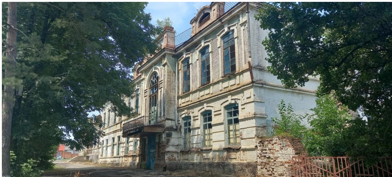
Рис. 1. Бывшее здание Ярославского двухклассного училища (ст. Ярославская, ул. Школьная, 21)

шая его с находящимся поблизости бывшим женским училищем [46; 47]. На сегодняшний день корпуса учебных заведений, по сути, составляют единый архитектурный комплекс, но «историческую» границу между ними можно легко заметить невооружённым глазом (рис. 1).