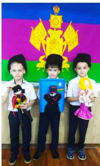
Рис. 1 Коллективно-творческое дело «Казачий костюм», МБОУ СОШ №15, Кавказский район

Проводим конкурсы, встречи и экскурсии, работаем