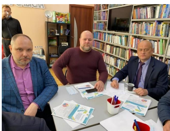
Рис. 2, 3. Стратегическая сессия «Стратегия социально-экономического развития МО Новокубанский район до 2030 года», г. Новокубанск, 2022 г.