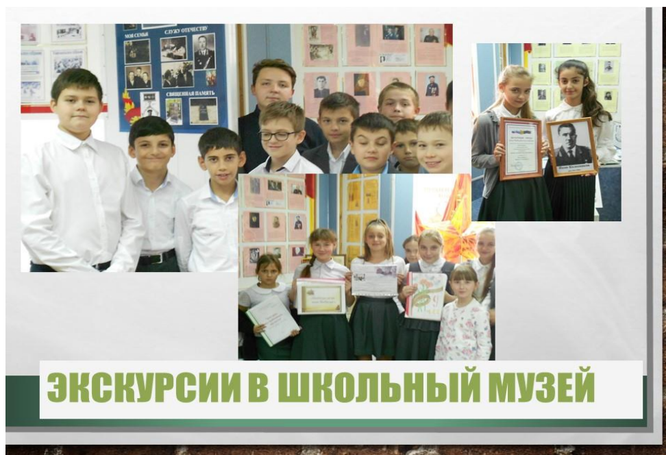
Рис. 1. МОБУ 2 им. И.С. Колесникова г. Новокубанска, 2020, экскурсии в школьный музей

Наилучшим способом обучения музейной педагогике является коллективная работа при организации работы музеев, составлении экспозиций, позволяющая более эффективно выстроить учебно-воспитательную работу с обучающимися. Ее высокая практическая значимость проявляется в том, что обучающиеся принимают активное участие на всех этапах организации экспозиции: сборе данных, анализе исторической ценности экспоната, его соотнесение с той или иной исторической эпохой, в возможной реконструкции или частичной реставрации. К эффективным методам музейной педагогики относится и метод моделирования, способствующий формированию и развитию активной деятельности учащихся в процессе изучения локальной истории.