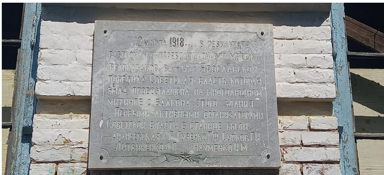
Рис. 3. Памятная табличка на здании бывшего двухклассного училища, ст. Ярославская