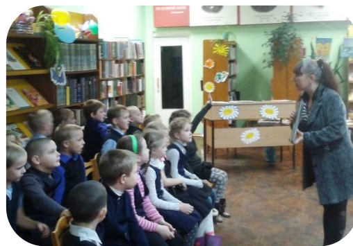
Проблемы кадрового обеспечения