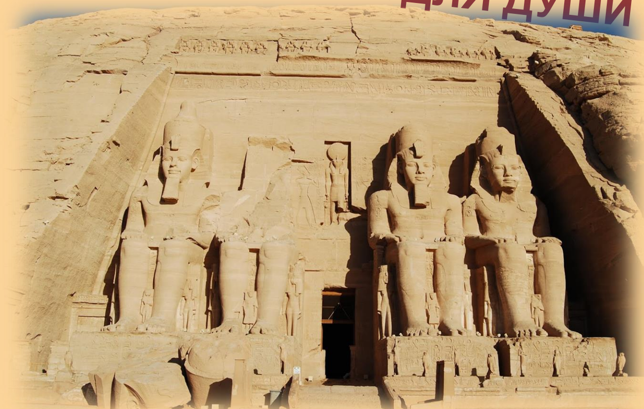
Библиотека фараона Рамзеса II (1300 год до н. э.) 16