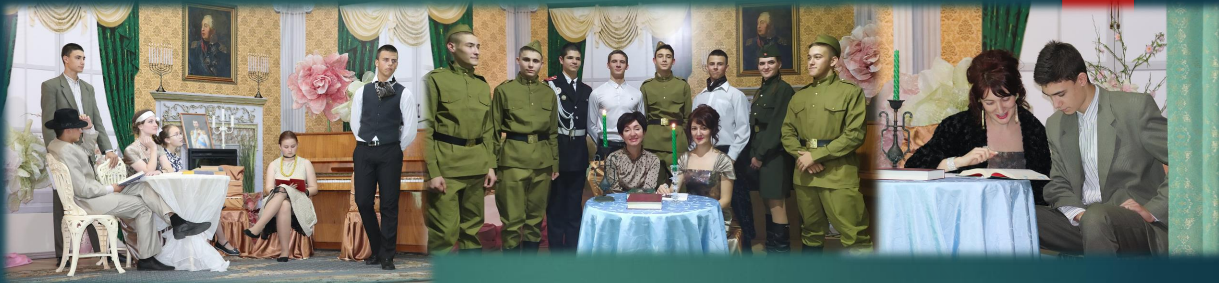
Литературная гостиная, посвященная творчеству Сергея Есенина