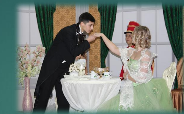
Литературная гостиная, посвященная творчеству А.С. Пушкина