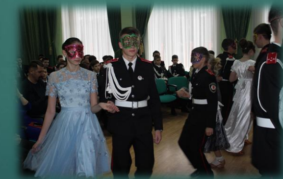
Литературная гостиная, посвященная творчеству М.Ю. Лермонтова