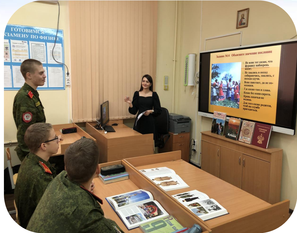
Рис. 1 Урок русского языка в 8 классе