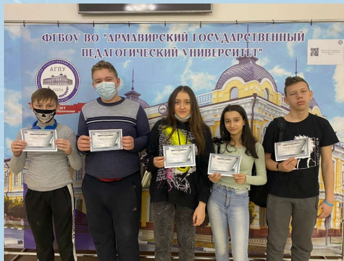
Мастер – класс