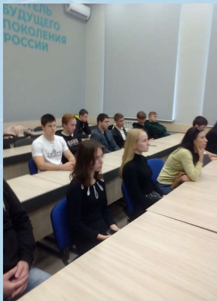
День открытых дверей