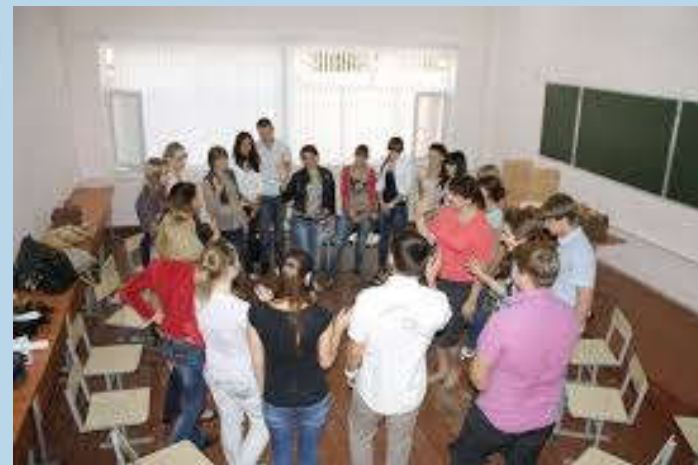
Деловые, профориентационные игры