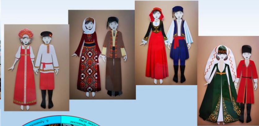
Демонстрационные материалы к экспозиции «Народные костюмы народов Причерноморья Кубани»