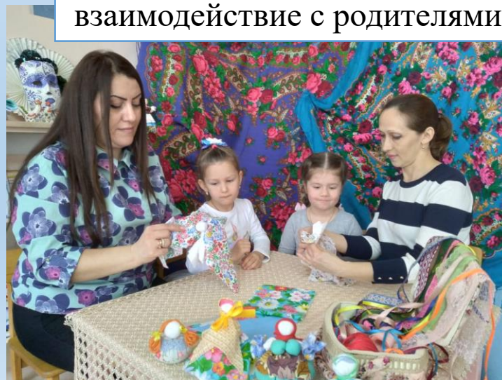
взаимодействие с родителями