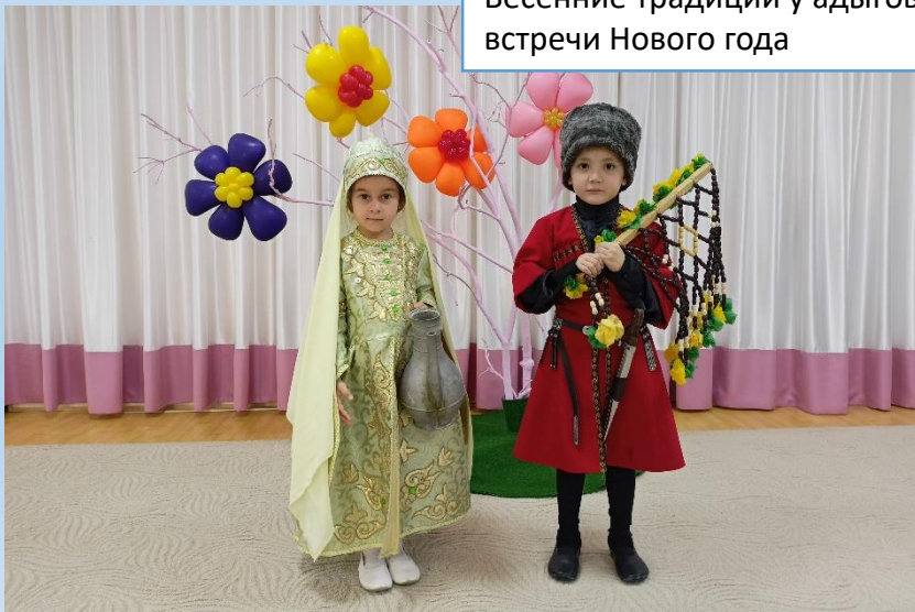
Весенние традиции у адыгов-шапсугов встречи Нового года