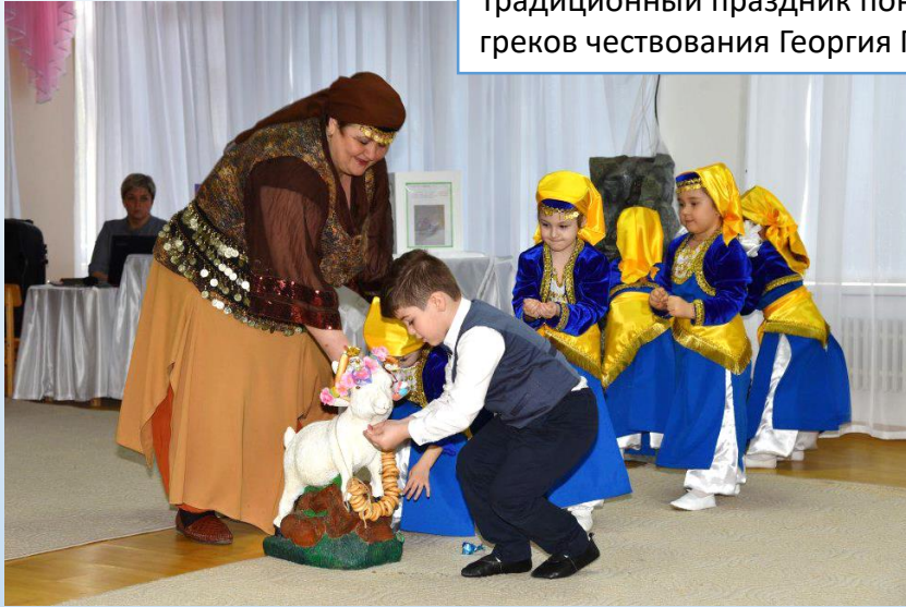
Традиционный праздник понтийских греков чествования Георгия Победоносца