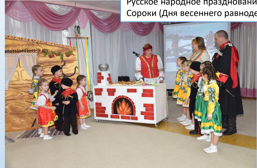
Русское народное празднование дня Сороки (Дня весеннего равноденствия)