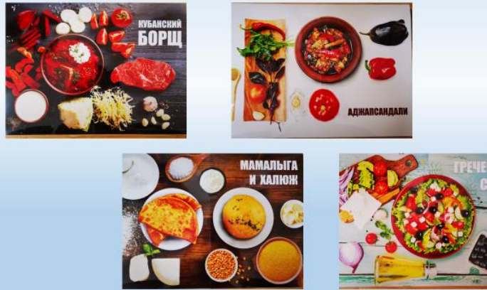
Демонстрационные материалы к экспозиции «Народная кухня»