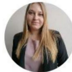
Блог здорового питания