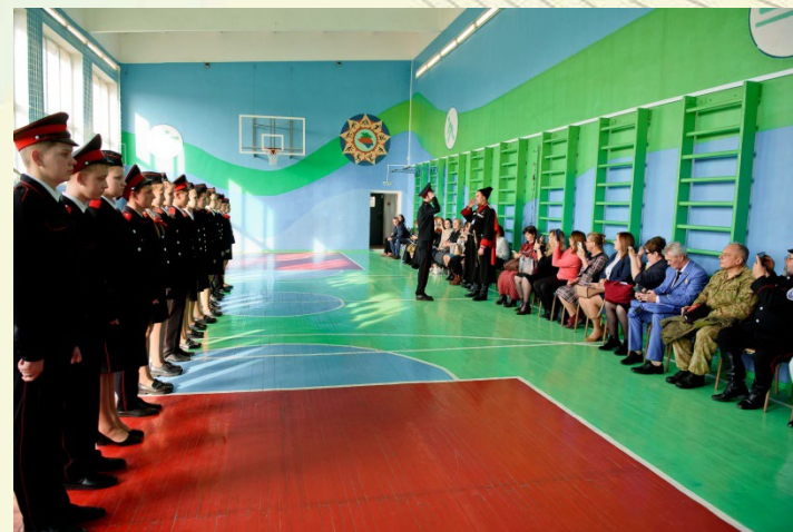
Конкурс строя и песни