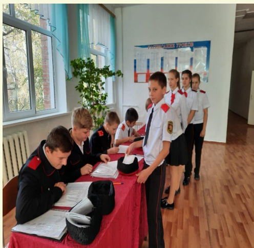
Выборы атамана школы