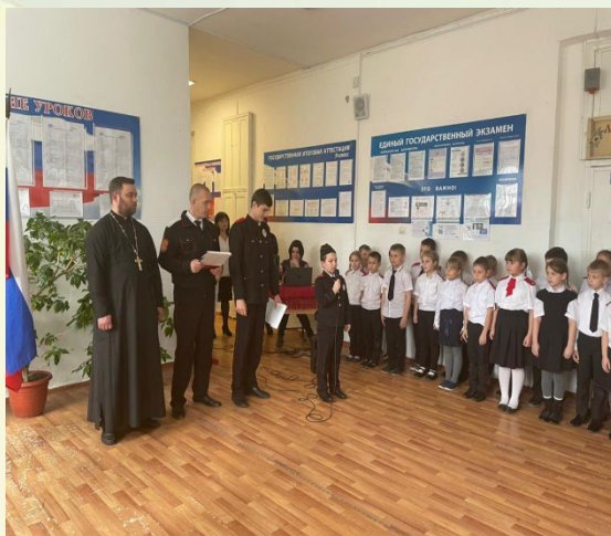
Посвящение в казачата