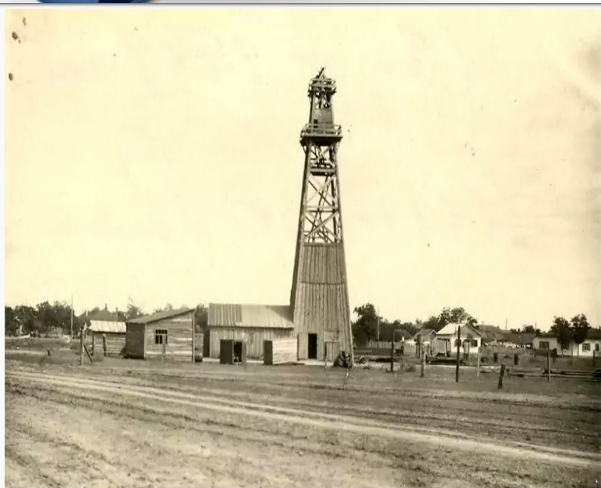
Бурение артезианской скважины

1892–1925, Россия, Краснодарский край, Ейский район, Ейск