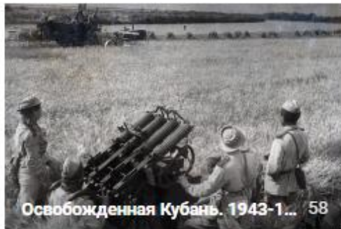
Освобожденная Кубань. 1943-1... 58