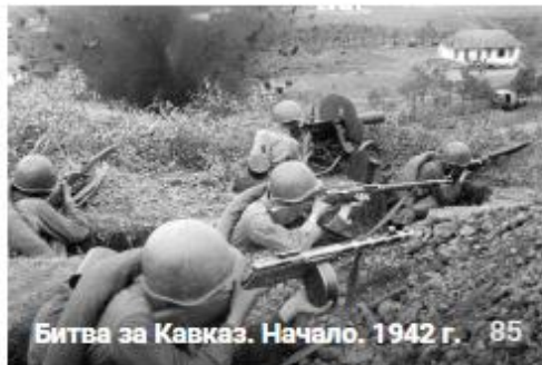
Битва за Кавказ. Начало. 1942 г. 85