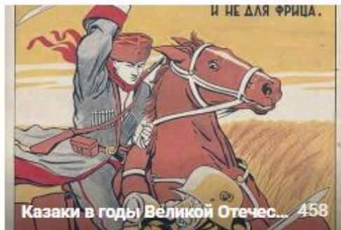
Казачи в годы Великой Отчес... 458