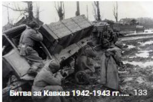
Битва за Кавказ 1942-1943 гг..... 133