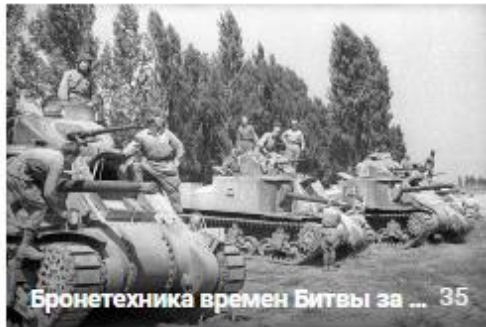
Бронетехника времен Битвы за ... 35