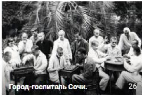
Город-госпиталь Сочи. 26