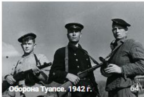
Оборона Туапсе. 1942 г. 64