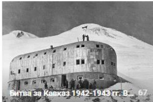
Битва за Кавказ 1942-1943 гг. В... 67