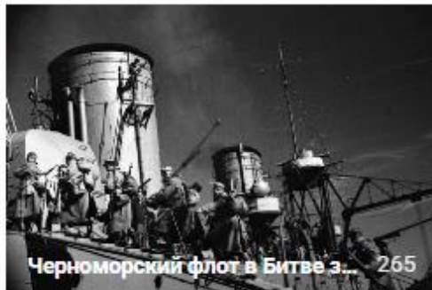
Черноморский флот в Битве з... 265