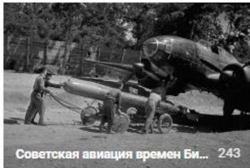
Советская авиация времен Би... 243