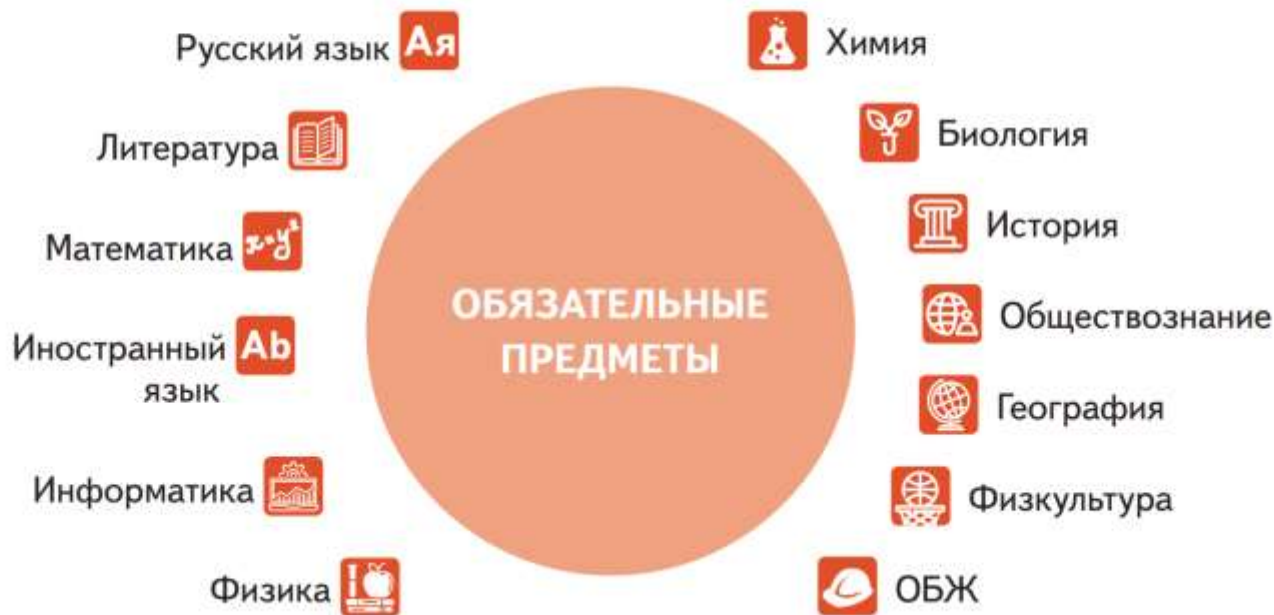
Рисунок. Обязательные предметы в аттестатах за 11-й класс по обновленному ФГОС