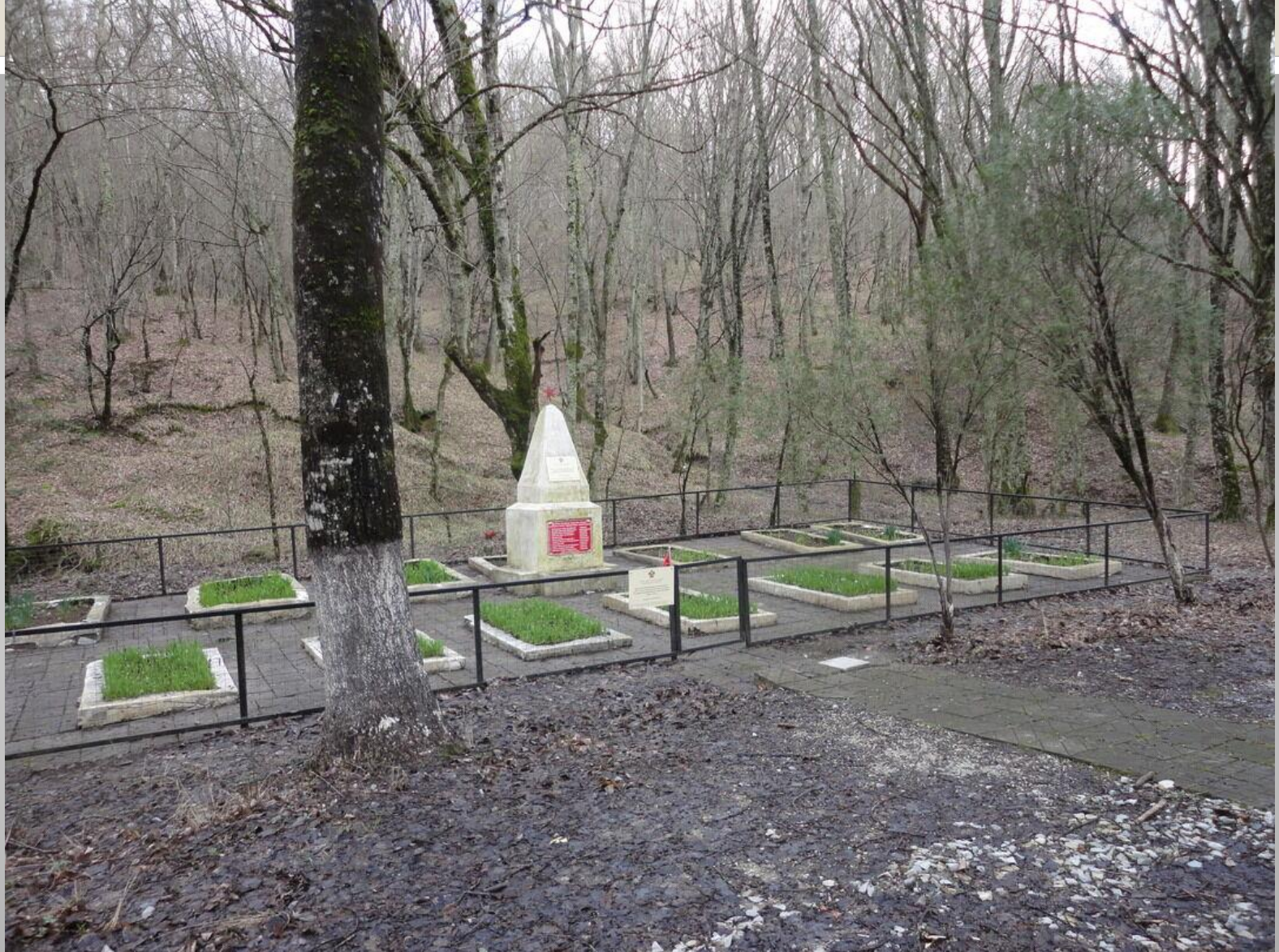
Братское кладбище (16 могил) советских воинов, погибших при защите и освобождении от немецко-фашистских захватчиков Михайловского перевала