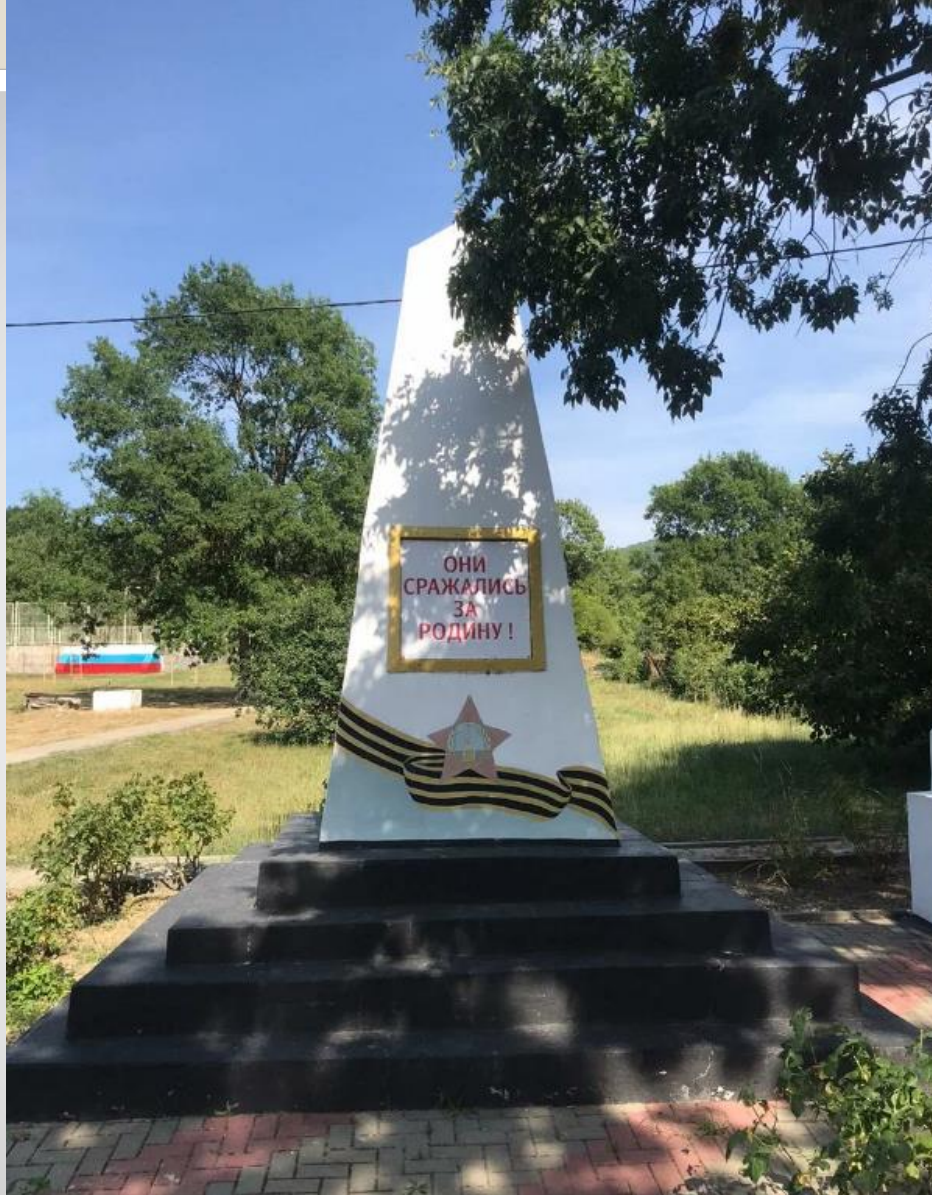
Братская могила 4-х летчиков в селе Береговое на территории школы